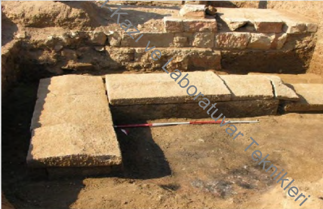
Parion Kazıları-Çanakkale Sandık Mezar