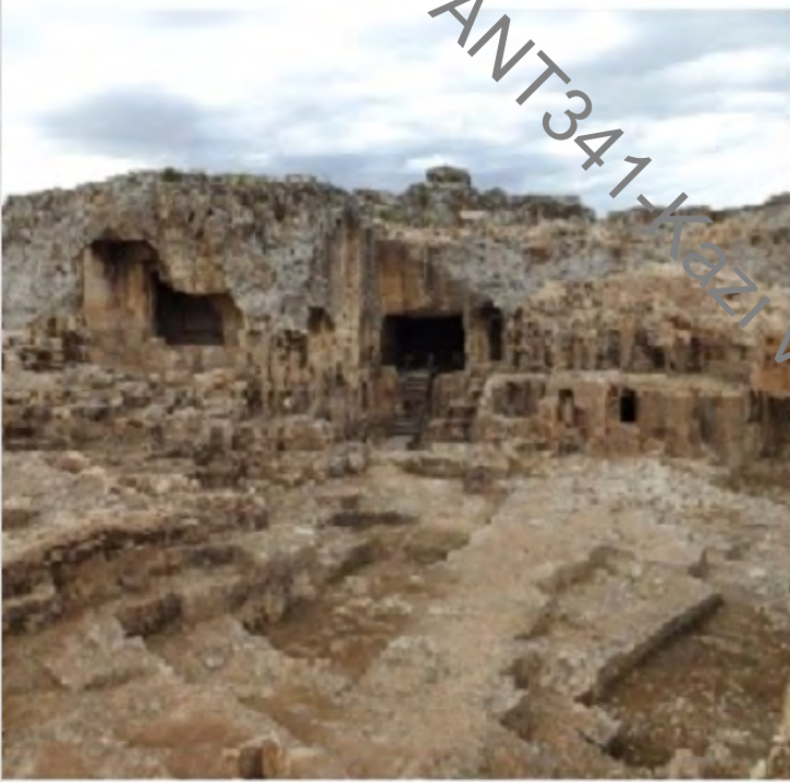
Hilar Mağaraları- Ergani Oda Mezarlar