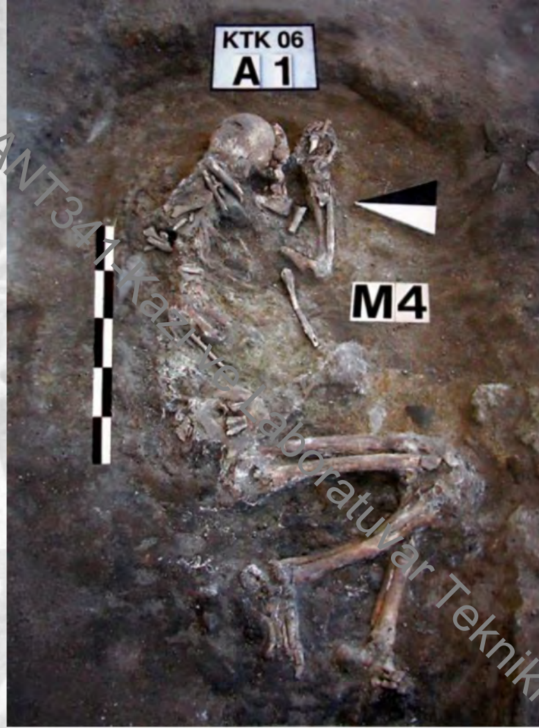
Körtiktepe Çanak Çömleksiz Dönem'e ait yarı hocker iskelet