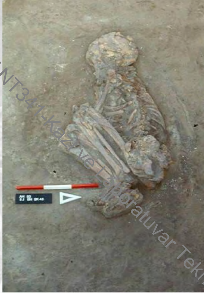
Aşıklıhöyük hocker pozisyonunda gömü