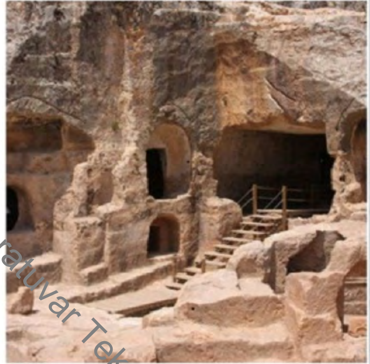
Hilar Mağaraları- Ergani Oda Mezarlar