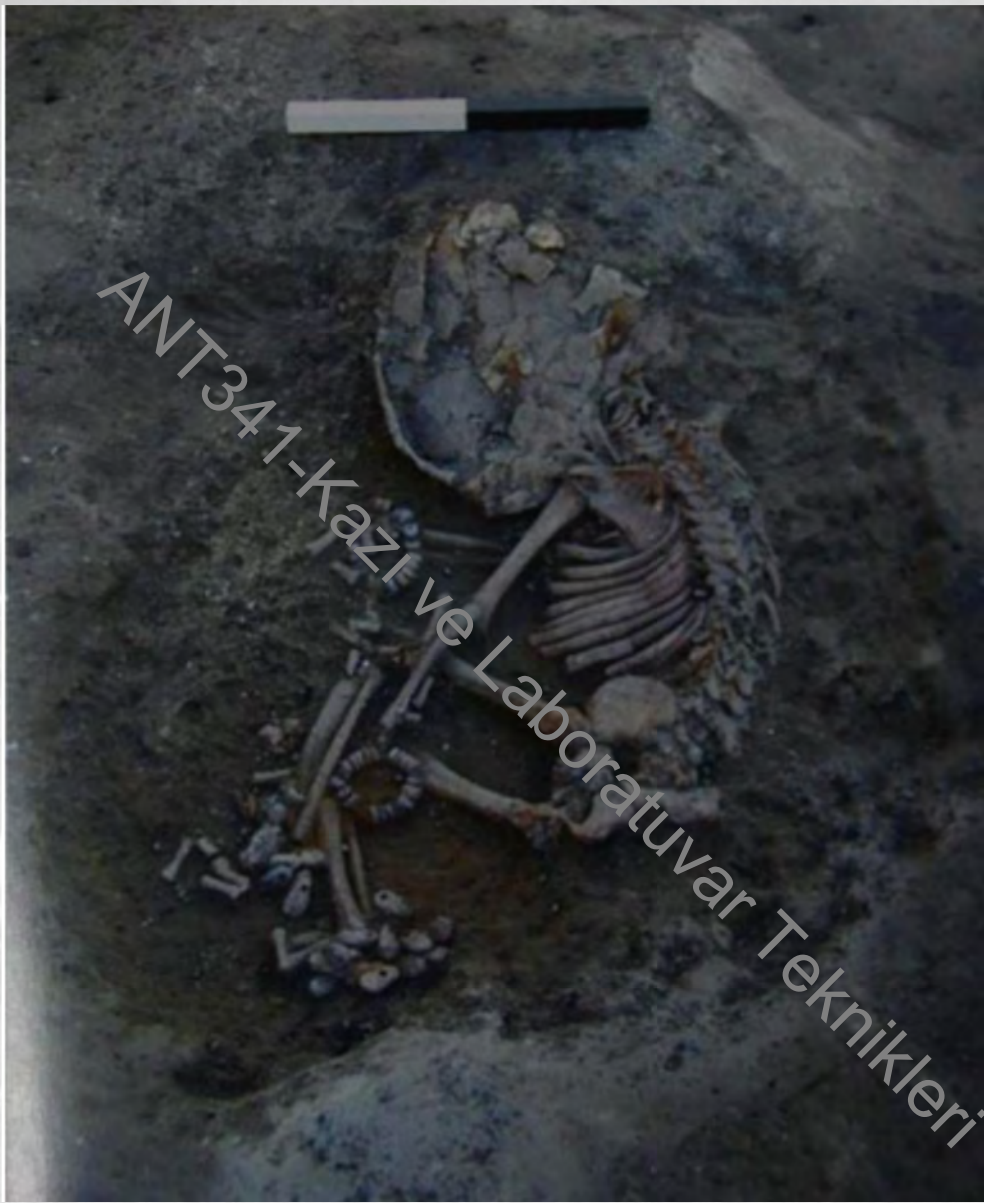
Çatalhöyük bilezikli ve halhallı bebek gömütü