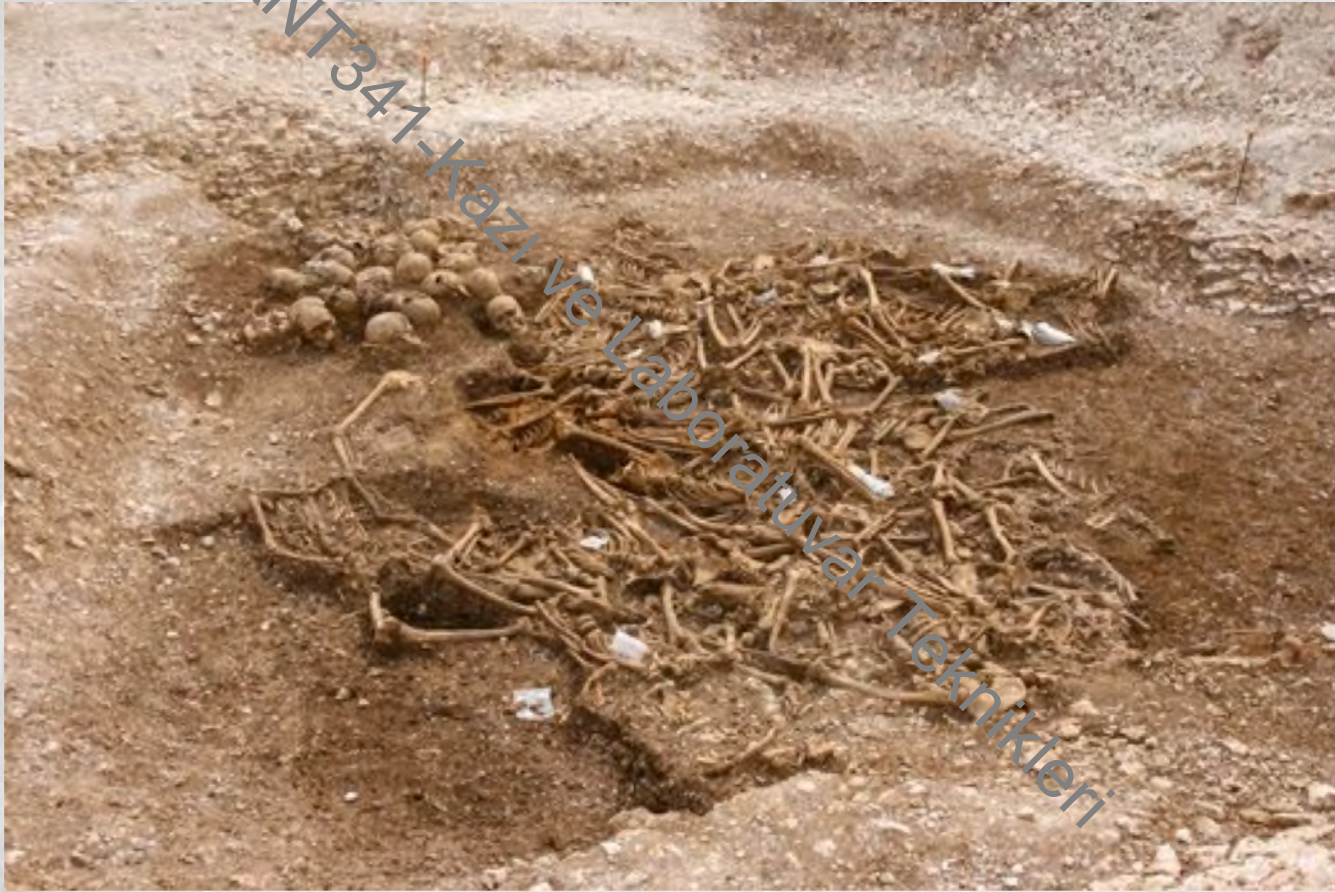
Viking Mass Grave