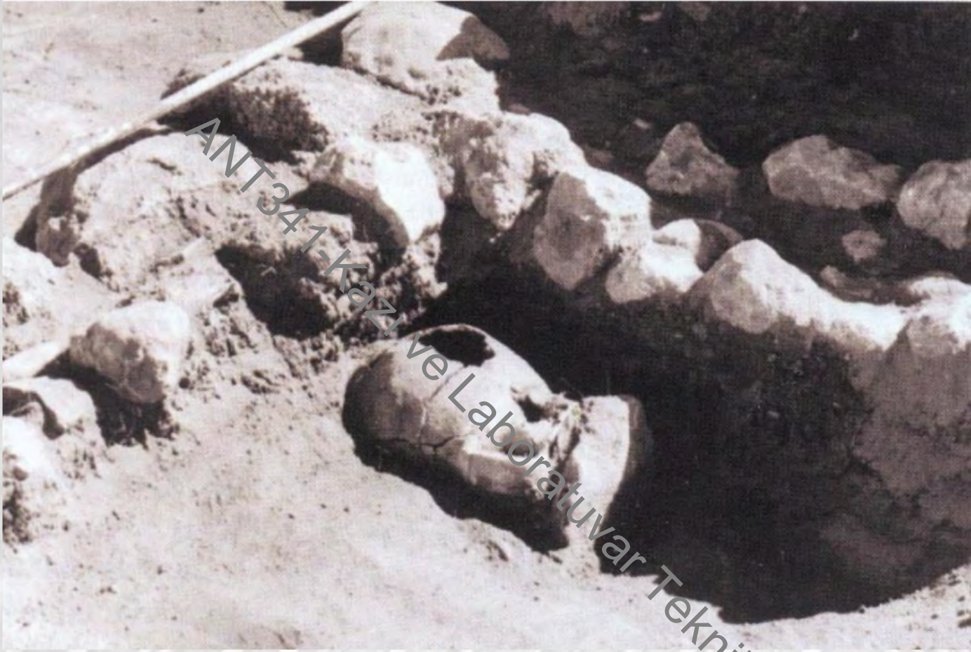
Kuruçay çömlek mezarı