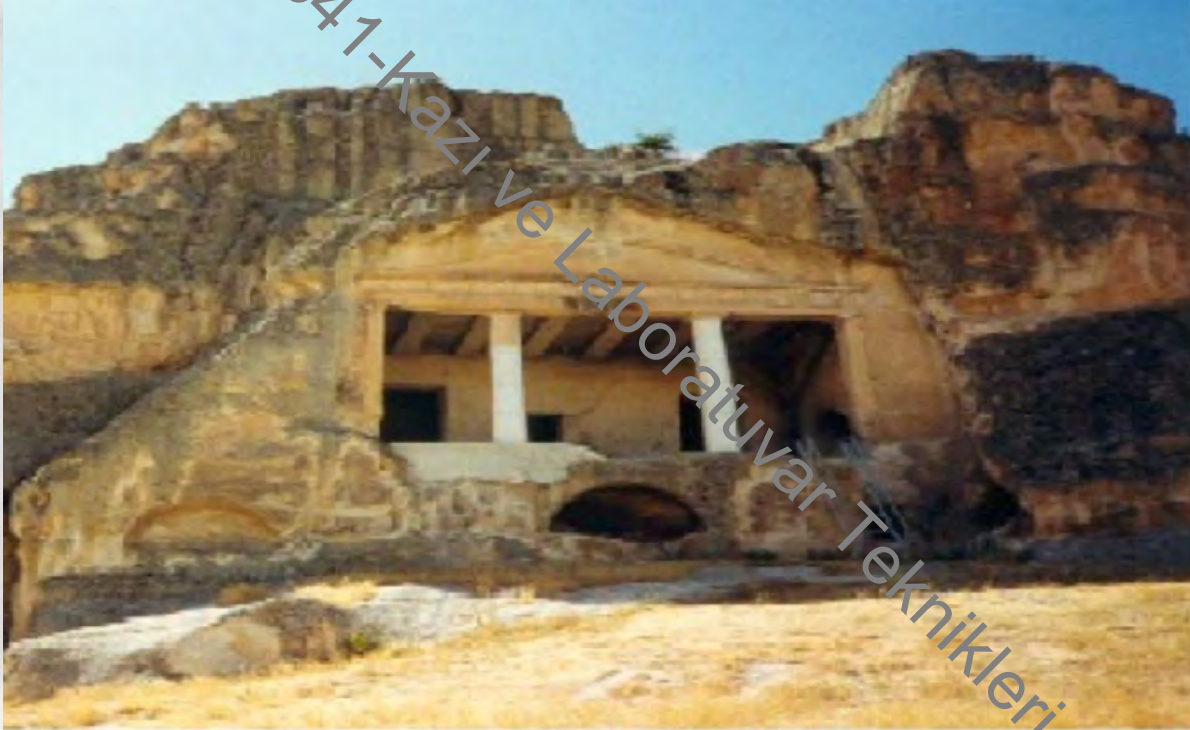
Gerdekkaya Mezarlığı-Eskişehir Kaya Mezar