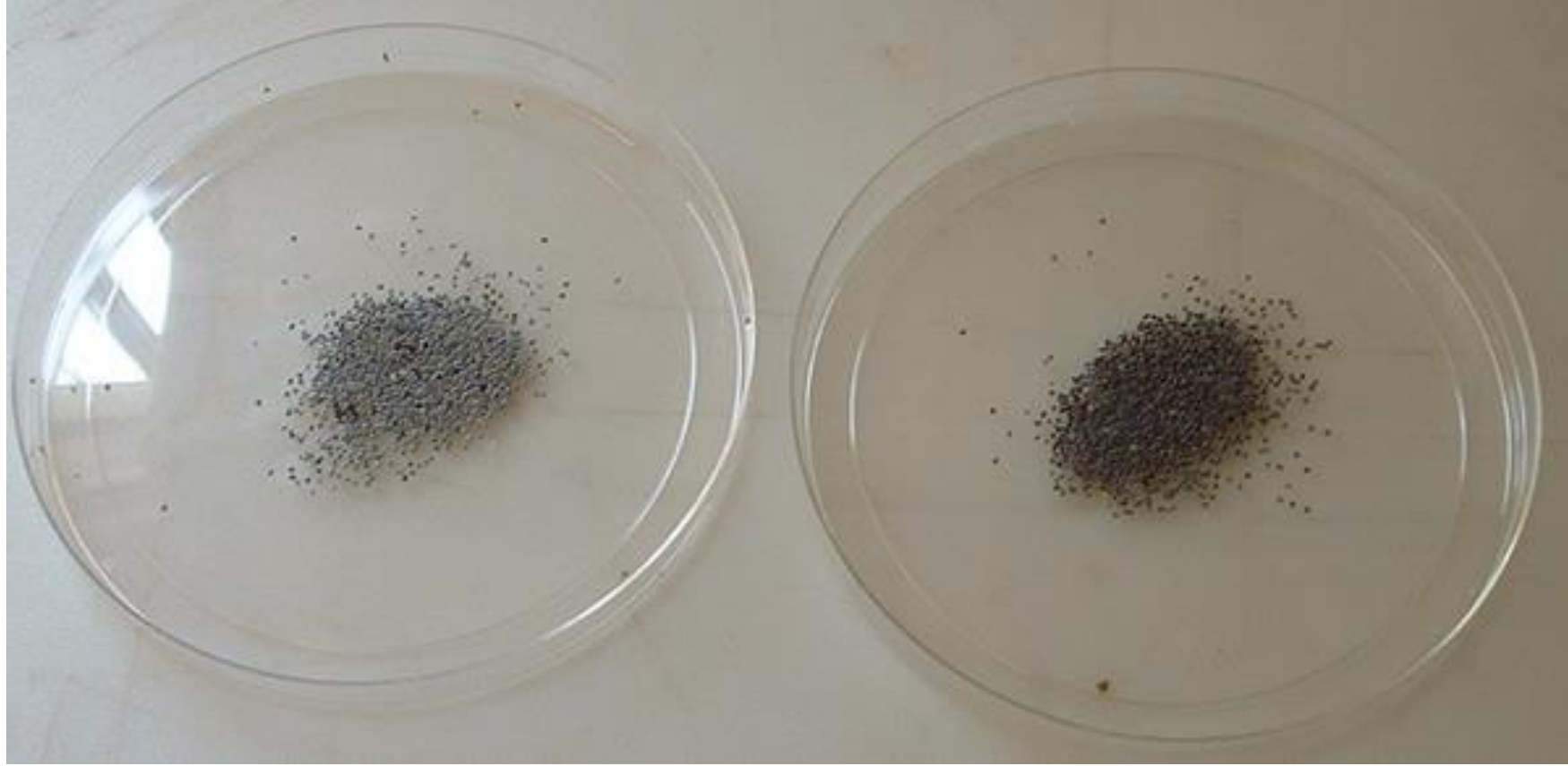
Çıkışa hazır yumurtalar