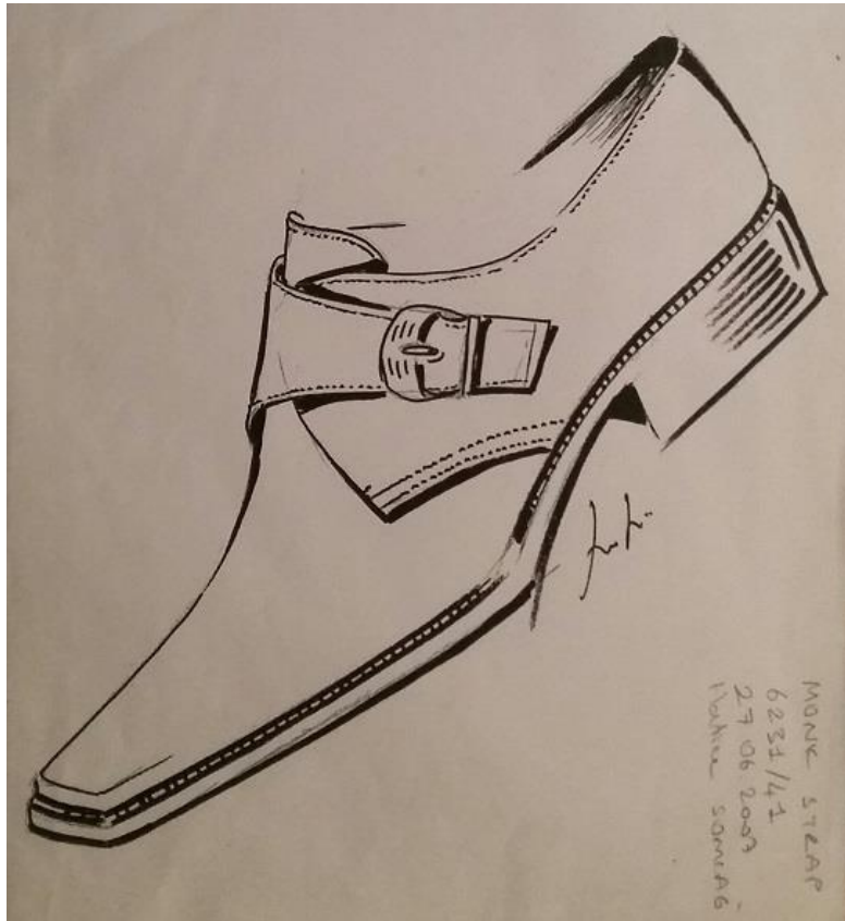
Monk Molyer Modeli