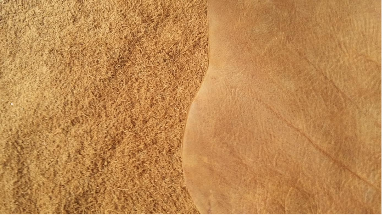
Sığır derisinin sırça ve tersten görünümü