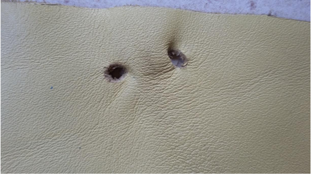
At sineği delikleri (nokra)