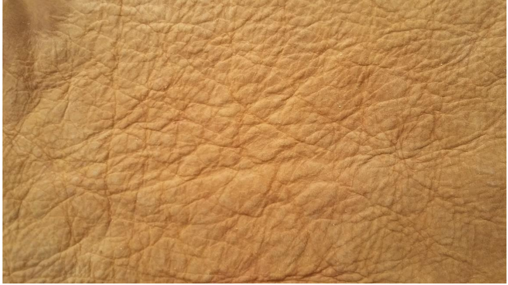
Derinin elastikiyeti olmayan koltukaltı kısmı