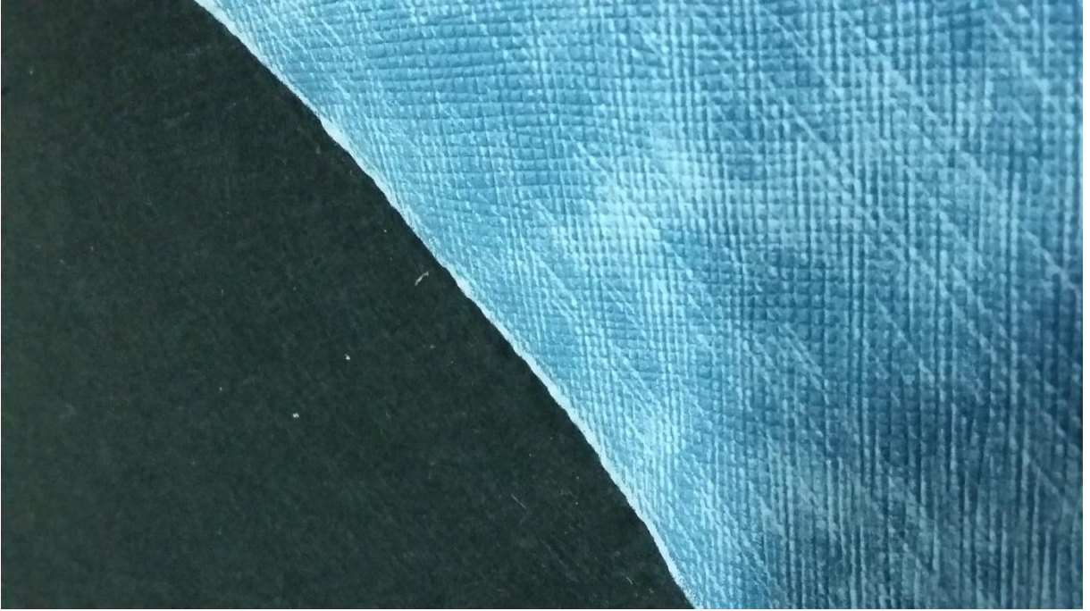
Keçemsi dokunmamıř yüzeyli suni deri