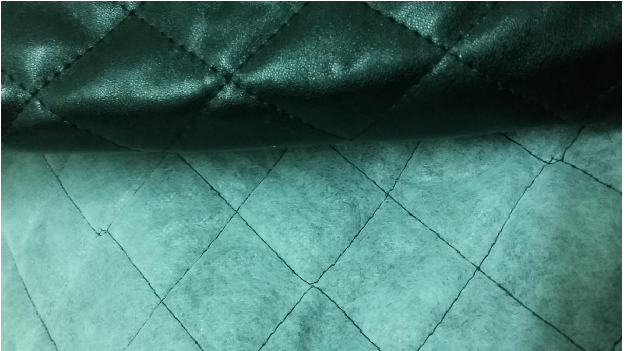
Altı elyaflı kapitone dikişli suni deri