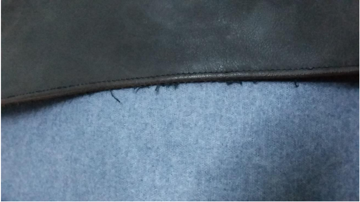
Tersi dokunmuş kumaşlı suni deri

Suni deriler örgü kumaş, dokuma kumaş veya dokunmamış yüzeylerin üzerine dökülen çeşitli içeriklerle hazırlanmış plastik maddelerden yapılmışlardır. Alta verilen fotoğraflarda ters ve düz tarafları ile suni deri çeşitleri görülmektedir.