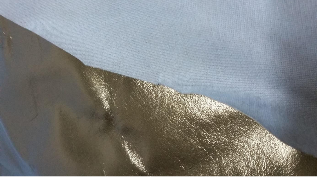
Dokuma kumařlı suni deri