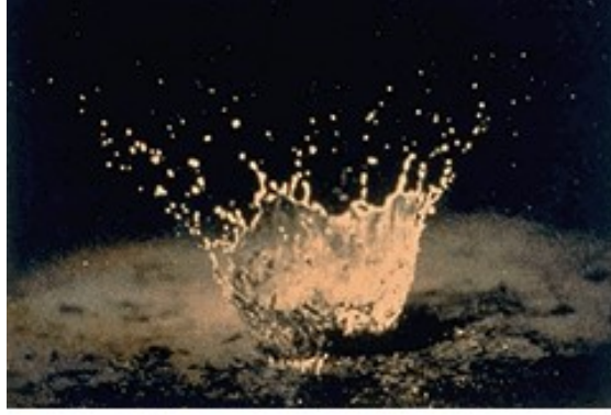
Resim Hata! Belgede belirtilen stilde metne rastlanmadı.-1 Yağmur damlasının vuruş etkisi

Yağmur damlaları yüzeye vurdukları toprak yüzeyinde bulanık çamurlu bir su filmi oluşmakta ve bu çamurlu (bulanık) suyun toprağın içine infiltre olması esnasında ince toprak zerreleri filtre edilmektedir. Dolayısıyla yüzeyde geçirimsizliği yağmur başlamadan önceki nazaran çok az olan bir katman oluşmaktadır. Bu katmana balçık katmanı (kaymak tabakası) denmektedir. Bu durum özellikle yağış şiddeti yüksek olan yağmurlarda meydana gelmektedir.