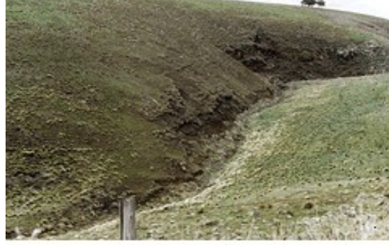
Resim Hata! Belgede belirtilen stilde metne rastlanmadı.-5 Oyuntu erozyonu

Toprak kaymaları ve kütle hareketleri; oyuntuların her iki yan kenarında hem sızma hem de yerçekimi kuvvetlerinin etkisi ile toprak kütlelerinin yüksek kısımdan aşağı kısma hareket etme eğilimi vardır. Bu kuvvetler toprak kütleleri içerisindeki kesme gerilimini teşvik eder ve toprak yeterli dirence sahip değilse yan yüzlerdeki toprak kütleleri oyuntu tabanına doğru kayar.