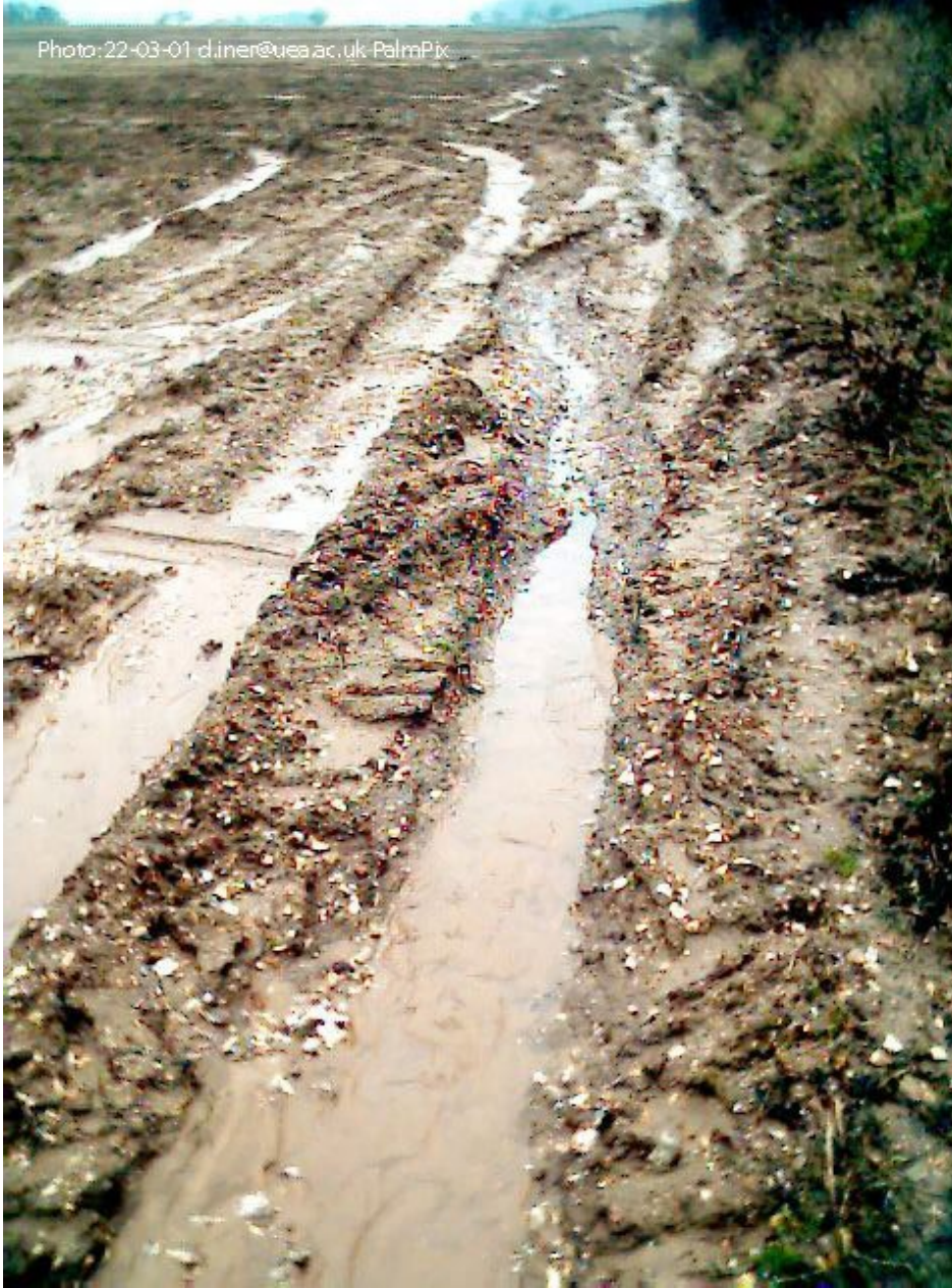
Resim Hata! Belgede belirtilen stilde metne rastlanmadı.-4 Parmak erozyonu

Yüzey akış suları, arazi yüzeyindeki çöküntülerde yoğunlaşmaya başladıklarında küçük ve fakat belirgin kanallar oluşturur ve toprakları uzaklaştırabilirler. Eğer bu kanallar normal sürüm işlemleri ile karıştırılmazlarsa parmak olarak adlandırılırlar. Bu küçük kanallar veya parmaklar normal sürüm işlemleri ile yok edilebildikleri için verimlilikte ciddi bir düşme oluncaya kadar bu tip erozyonda dikkatlerden kaçabilir. 15 t/ha dan daha fazla erozyon oluşan yerlerde parmaklar oluşmakta olup su akış kanallarının derinlikleri 30 cm den azdır.