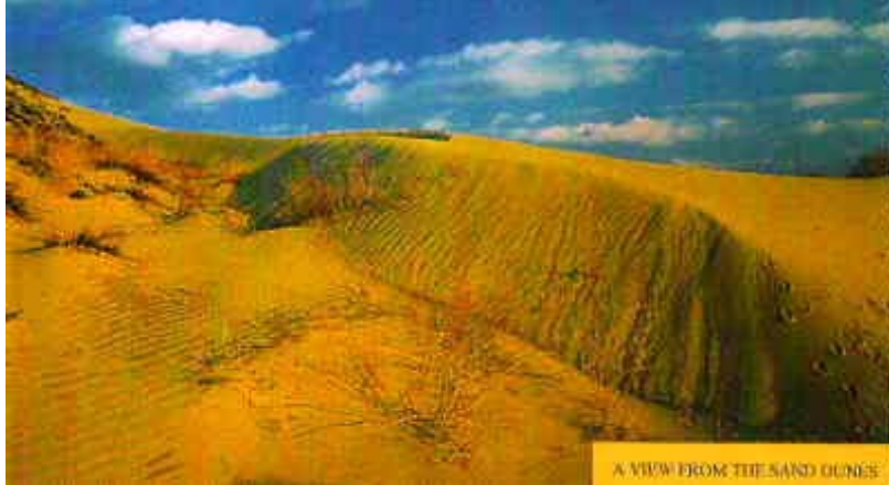
Resim Hata! Belgede belirtilen stilde metne rastlanmadı.-9 Konya - Karapınar'da bir kumul

Rüzgâr erozyonu konusu 5. bölümde daha detaylı olarak açıklanacağından bu bölümde sadece bir erozyon şekli olarak kısaca değinilecektir. Rüzgâr erozyonunda ana faktör hareket eden rüzgârın hızıdır ve toprak yüzeyindeki rüzgâr hızı, toprak pürüzlülüğü, taşlar, bitki örtüsü ve diğer engeller tarafından kesildiği için en düşük düzeydedir. Bu bakımdan rüzgâr erozyonu esas itibarıyla çıplak arazi yüzeylerinde meydana gelmektedir