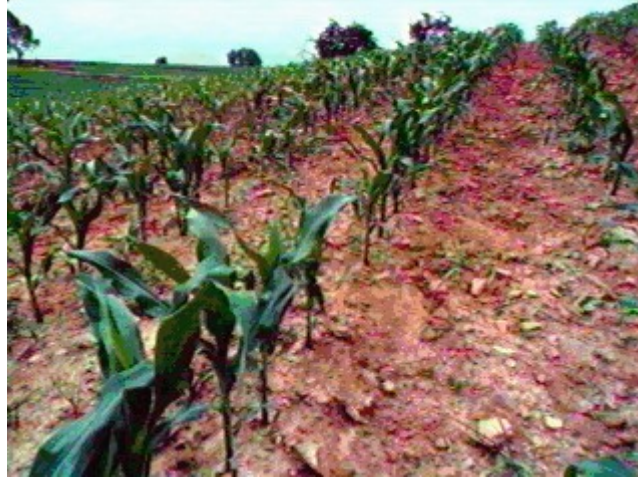
Resim Hata! Belgede belirtilen stilde metne rastlanmadı.-2 Yüzey erozyonu

Toprak parçacıkları yuvarlanma, yükselme ve aşındırma olaylarının birlikte etkileri sonucu buldukları yerden sökülürler (parçalanma). Toprak yüzeyinde su akmaya başladığında yatay kuvvetler toprak tanecikleri üzerinde akış yönünde hareket ettirme yönünde etkili olurlar. Bu kuvvetler toprak parçacıklarının toprak kütesinden ayrılmalarını ve yuvarlanmalarını sağlarlar. Yüzey akışlar çöküntülerde ne kadar fazla konsantrasyon olurlarsa akışta o kadar fazla çalkantılı olmaktadır. Çalkantılı akımda oluşan değişik hız ve basınçlar dikey akım ve anafollara neden olmaktadır. Su bu şekilde yukarıya doğru olan hareketi ile üzerinden geçtiği toprak parçacıklarını da yerinden sökmektedir. Aşındırma suretiyle toprak taneciklerinin yerinden sökülmesi ise akan su içerisinde hareket halindeki materyalin toprak yüzeyine çarpmaları veya sürtünmeleri sonucunda toprak taneciklerini de harekete geçirmesidir.