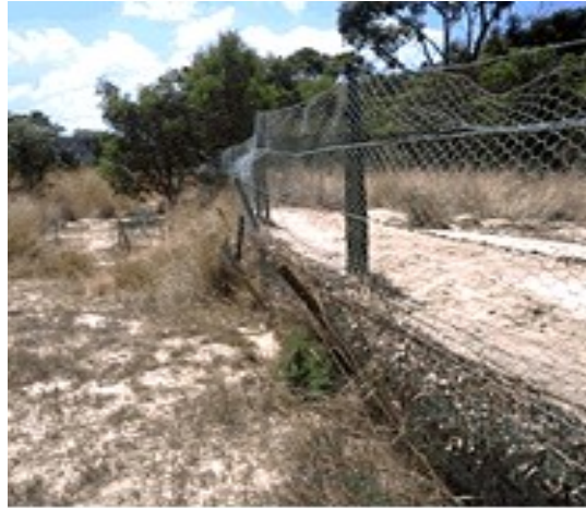
Resim Hata! Belgede belirtilen stilde metne rastlanmadı.-3 Bir çit boyunca sediment birikintileri erozyonun göstergesidir

Toprak parçacıkları; yüzey sürüklenmesi, süspansiyon ve sıçrama hareketlerinin birleşimi ile taşınırlar. Yüzeyden akan suyun oluşturduğu yatay kuvvetler toprak taneciklerini arazi yüzeyi ile temas halinde ve kayarak veya yuvarlanarak hareket ettirirler ki buna yüzey sürüklenmesi denmektedir. Sıçrama hareketi su akıntısının çalkantılı olması durumunda taneciklerin yüzeyden yükselmeleri ve bu hareketin devamlı bir şekilde meydana gelmesi ile oluşur. Akış içinde yukarıya doğru olan kaldırma hızı taneciklerin çökme hızından fazla olduğu takdirde süspansiyon şeklinde hareket başlar ve bu şekilde tanecikler çökmeden uzun mesafeler için hareket edebilirler.