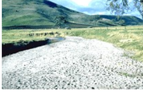
Resim Hata! Belgede belirtilen stilde metne rastlanmadı.-6 Erozyon sonucunda oluşmuş bir dere yatağındaki sedimentler

Su akış yolunun düzensiz ve menderesli olması kenar erozyonunu artırmaktadır ( Resim 2.7 ). Akarsu yatağının aşındırılmasında su akıntısının hızı ve yönü, akarsu kanalının derinlik ve genişliği ve yatağın üzerinden aktığı malzemenin cinsinin önemi vardır.