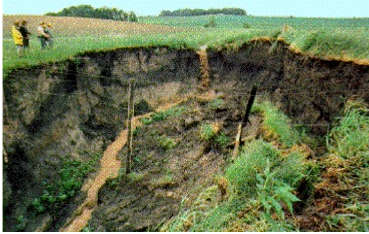
Resim Hata! Belgede belirtilen stilde metne rastlanmadı.-8 Heyelan

Kayma genellikle jeolojik erozyon olayıdır ve insanların bir etkisi olmaksızın oyuntuların yan yüzeylerinde meydana gelir. Genellikle yüksek yağışlı ve derin topraklara sahip yerlerde oluşur ve bu yerlerdeki oyuntuların gelişmesinde ana etmendir. Oyuntuların baş kısmında herhangi bir (oyuntu içine doğru) akış olmamasına rağmen oyuntu başı geriye doğru gitmektedir ki bunun ana nedeni kayma olayıdır. Oyuntular kanallardaki taşkın akışı ile başlamakta ve sonra erozyon sadece kayma ile devam etmektedir. Kaymanın diğer nedenleri de akarsu kenar ve kıyı erozyonudur.