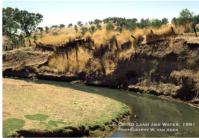
Resim Hata! Belgede belirtilen stilde metne rastlanmadı.-7 Akarsu kenar erozyonu

Su akış yolunun düzensiz ve menderesli olması kenar erozyonunu artırmaktadır ( Resim 2.7 ). Akarsu yatağının aşındırılmasında su akıntısının hızı ve yönü, akarsu kanalının derinlik ve genişliği ve yatağın üzerinden aktığı malzemenin cinsinin önemi vardır.