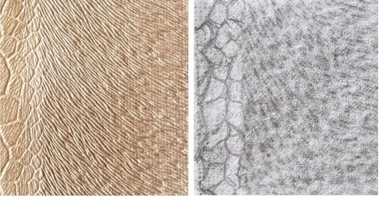
Örnek Deri Etüdleri

Çizim deriyi daha dikkatli inceleme imkânı sağlar. Derinin doku özellikleri ve ışık-gölgesi incelenerek ve gözlemlenerek resmedilmelidir.