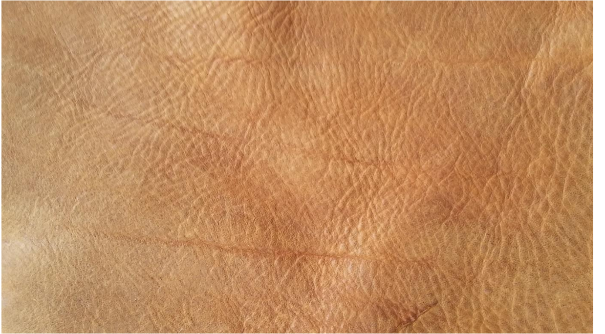
Derinin yakından görünümü