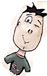
un nepot de 5 ani