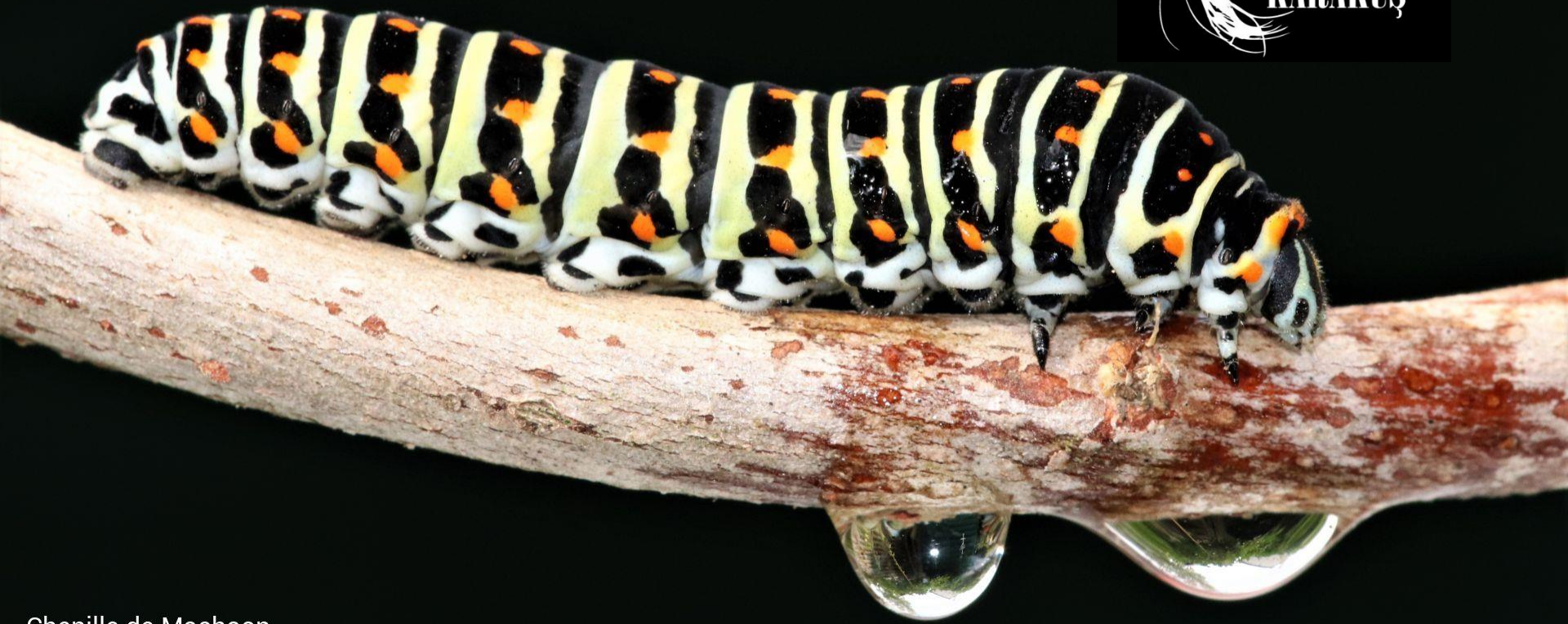
Chenille de Machaon