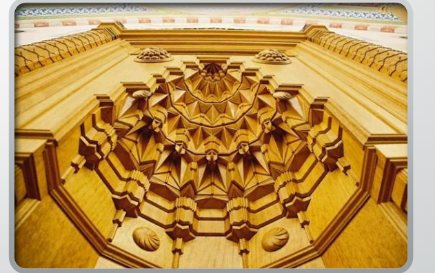
Kündekari tekniğinde işlenmiş bir mihrap