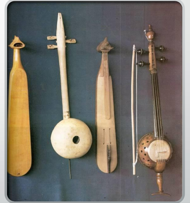
Kabak kemane ve hegit