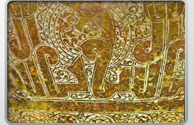
Konuşan insan figürlü kûfi hat