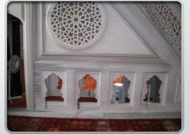
Düzce Merkez Büyük Cami minberi