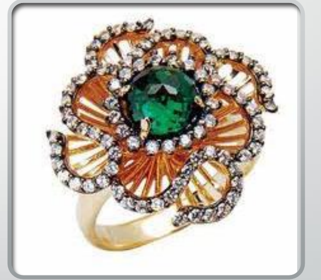
Zmrt ve pırlantalı yzk