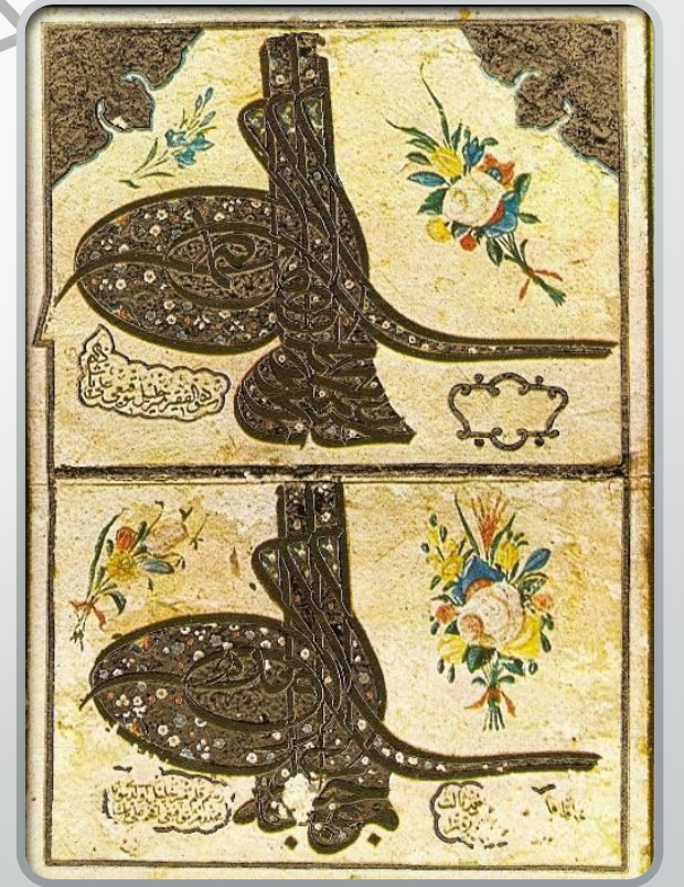
Sultan 2. Abdülhamit'e ait tuğra ve aynı tarzda istif edilmiş yazı