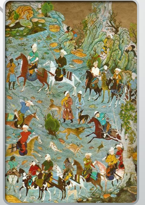
Sultan ve maiyetinin av partisi, 1496