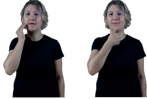
ANNENNE - BABAANNE