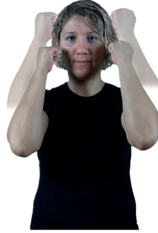
ŞAPKA - BERE