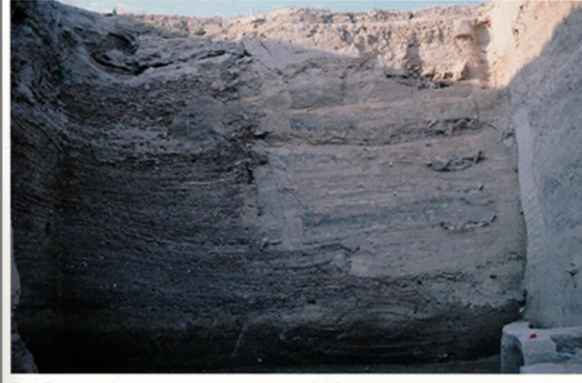
Fig. 8. The south profile of the deep sounding in the trenches 4 G-H. Building phases of level 2 and 3. View from the North.