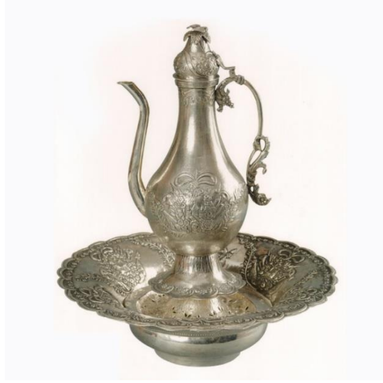
Leğen- İbrik Örneği

Lif Leğenleri: Lif leğenleri daha çok bakırdan yapılmıştır