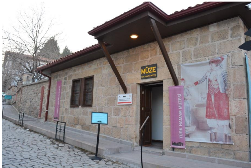
Beypazarı Türk Hamam Müzesi

Türkiye'nin ilk Türk Hamamı Müzesi, Ankara Kalkınma Ajansı'nın desteği ile Sema Demir'in hazırladığı "Sürdürülebilir Bir Turizm için Uygulamalı Hamam Müzesi" projesi ile Beypazarı'nda 2012 yılında hayata geçirilmiştir (Demir, 2013). 16. yüzyılda Kanuni Sultan Süleyman'ın damadı ve veziri olan Rüstem Paşa'nın yaptırdığı 32 hamamdan biri olan ve yakın bir döneme kadar kullanıldıktan sonra işlevselliğini yitiren Rüstem Paşa Hamamı'nda çok sayıda obje sergilenmektedir (Anonim 2016a)