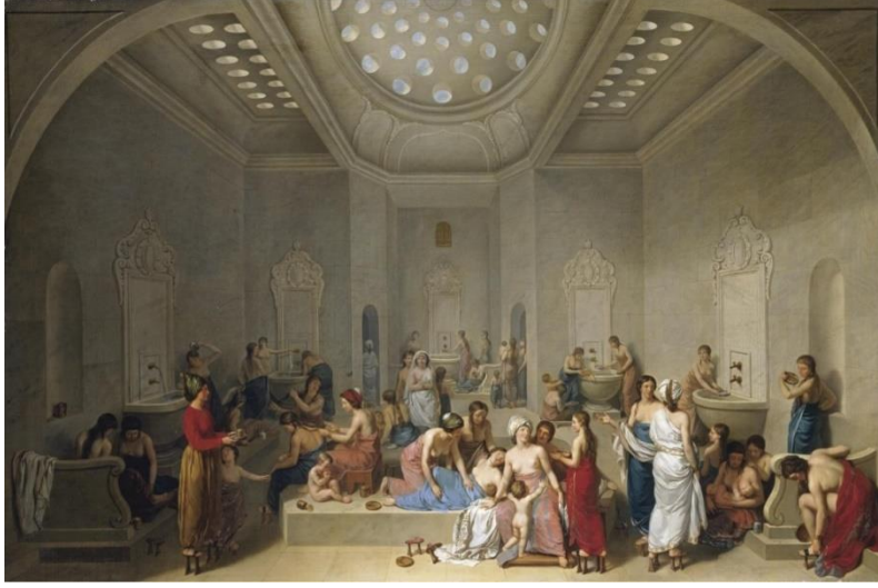
Türk Kadınlar Hamamı ( J. J. F. le Barbier)

Fransız resam Jean Jacques Francois Le Barbier (1738-1826) tarafından, 1785 yılında yapılan kadınlar hamamı konulu yağlı boya tablo