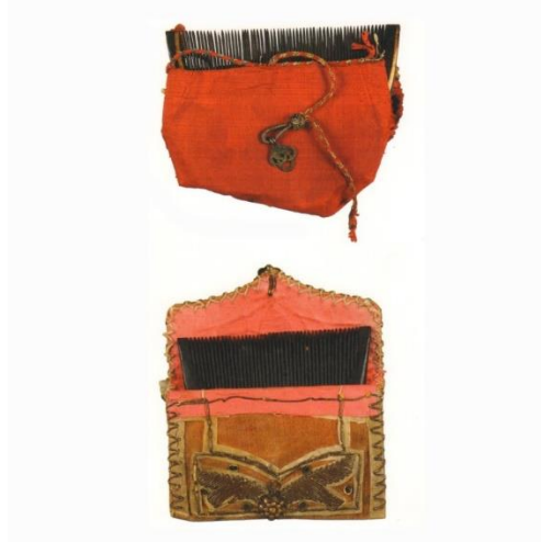
Tarak Kesesi Örnekleri

Aynalar: Tuğra, bitki ve hayvan desenleri ile ya da değerli taşlar ile süslü gümüş ve ahşap aynalar kullanılmış, gümüş aynalar şık kutular içine yerleştirilmiştir.