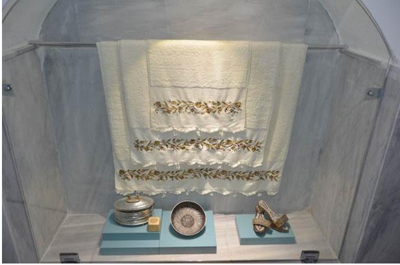
Beykozar TürK Hamam Müzesi İç Mekan Görünümü

Hamam Tası: Hamamlarda kurnadan suyu alarak yıkanmak için kullanılan, çapları 11.5 cm ile 27 cm arasında deęişen objelerdir. Anadolu'nun zengin antik çağ kültürünü günümüze kadar taşıyan en uzun soluklu tasarım hamam tası tasarımıdır. Genellikle kabartma ya da kakma teknięi ile çalıřılan hamam tasları yivli, bitkisel, hayvansal ya da geometrik motiflerden oluşmaktadır. Hamam taslarının gümüş, bakır ve pirinçten yapılan örnekleri mevcuttur