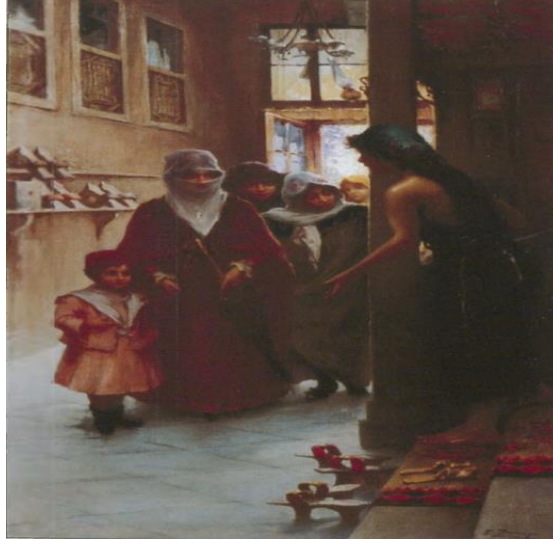
Hamama Giriş (F. Zonaro) (Anonim 2016h)

sayıda tablo yapmıştır. Zonaro'nun, "Hamama Giriş", "Hamamda Yıkaniş" ve "Banyodan Sonra İstirahat" isimleri ile anılan üçlemesi