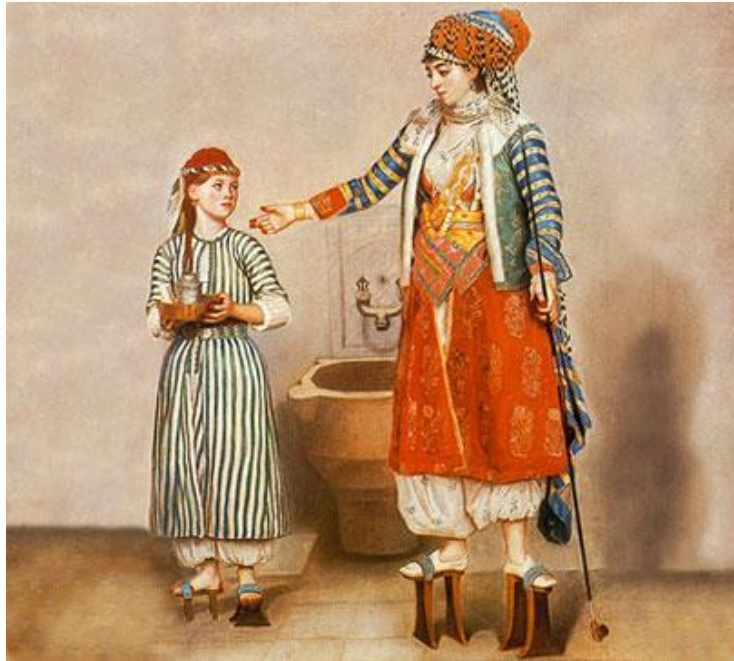
Hamamda Kadın ve Hizmetçisi (J. E.Liotard)

İsviçre kökenli Fransız ressam Jean Etienne Liotard (1702 -1789), bir kadını kına taşı taşıyan hizmetçisi ile resmetmiştir. Liotard'ın “Hamamda Kadın ve Hizmetçisi” isimli tablosu