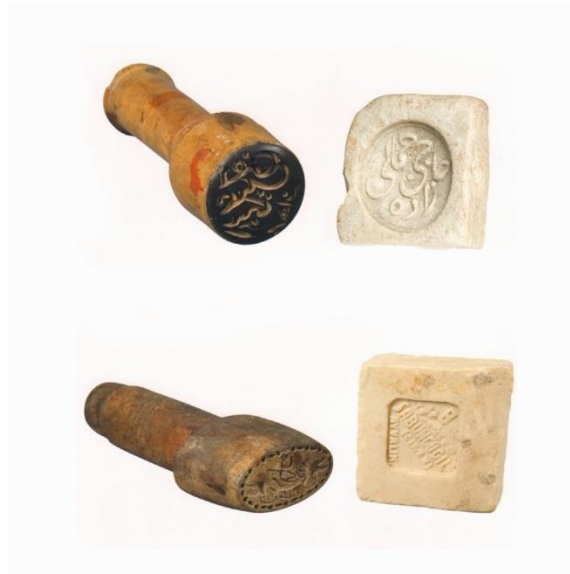
Sabun ve Damga Örnekleri

Sabun: Fenikeliler ve Roma döneminde sabun önemli bir deęişim aracı, ticari bir metadır. Roma hamamlarında olduđu kadar Osmanlı hamamlarında da önemli olan sabunlar, Osmanlı'da aile işletmelerinde üretilmiş, sabunda üretici ailenin damgasına yer verilmiştir. Sabunların yükseklikleri 4.5 cm ile 6 cm arasındadır.