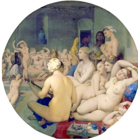
Türk Hamamı (J. A. D. Ingres)

Batılı ressam (Fransız) Jean Auguste Dominique Ingres (1780-1867), İstanbul'da hiç bulunmamasına rağmen, Lady Montagu'nun mektuplarından esinlenerek "Türk Hamamı" adlı bir tablo yapmıştır. Bu tablo bilinmesi gereken en önemli elli tablo arasında yer almaktadır. Önce kare formda çalışılan resim, daha sonra daire içine alınarak kadınların hamam sefası anahtar deliğinden izleniyor izlenimi yaratılmıştır.