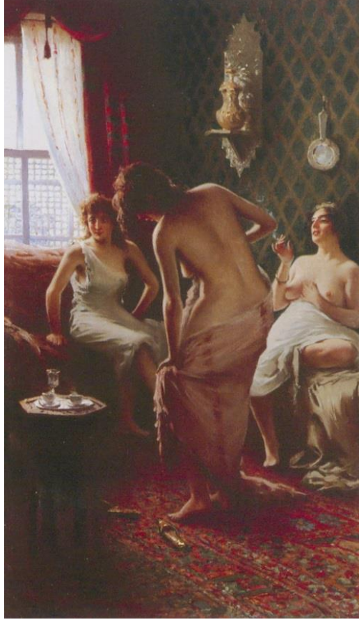
.Banyodan Sonra İstirahat (F. Zonaro) (Anonim 2016h)