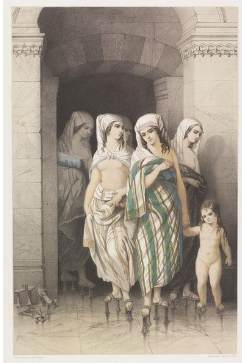
Kadınlar Hamamında Bir Aile (C. Rogier) (Anonim 2016g)

II. Abdülhamit döneminde saray ressamlığı görevine getirilen İtalyan ressam Fausto Zonaro, eşinin çektiği fotoğraflardan yararlanarak (1854-1929), kadınlar hamamını konu alan çok