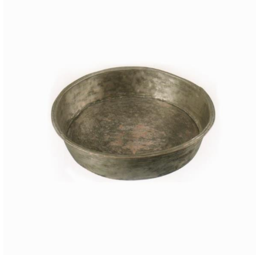
Lif Leğeni Örneği

Lif Leğenleri: Lif leğenleri daha çok bakırdan yapılmıştır