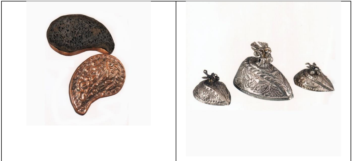
Topuk Taşı Örnekleri

Topuk taşı-Ponza taşı: Siyah ya da beyaz renkli olarak doğada bulunan topuk taşları hamam eşyalarının önemli bir parçasını oluşturur. Kullananların ekonomik durumuna göre, bakır ve gümüş ya da sade tipleri mevcuttur.