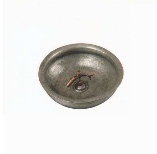
Hamam Tası Örnekleri

Leęen-İbrik: Hamamda abdest almak için kullanılan, yükseklikleri 33 cm ile 50 cm arasında deęişen malzemelerdir. Kirli suyun görünmemesi için leęen ve ibrik arasında sabunluk denilen süzgeç bulunur. Genellikle kabartma teknikli olup; yivli, bitkisel, hayvansal ya da geometrik motifler ile süslüdür. Gümüş, bakır ve pirinçten yapılan örnekleri yaygındır.