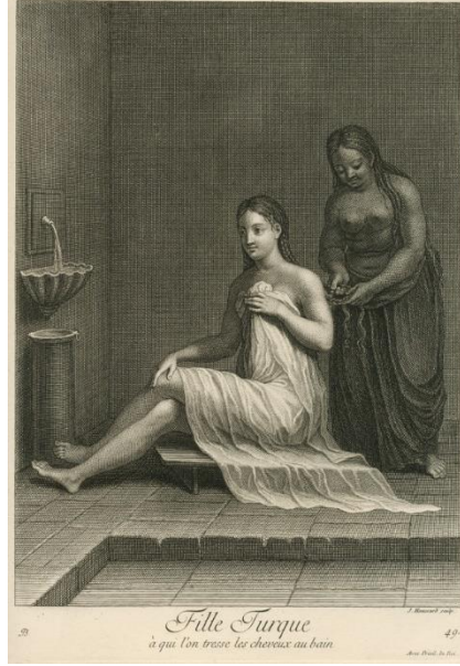
Kurnanın Önünde Hizmetçisi ve Genç Kız ( J. B. Van Mour)

Flaman asıllı Fransız ressam Jean Baptiste Van Mour (1671-1737) “Soğuklukta Dinlenen Kadın” ve “Kurnanın Önünde Hizmetçisi ve Genç Kız” isimli resimleri ile ün kazanmıştır. “Kurnanın Önünde Hizmetçisi ve Genç Kız” isimli çalışma