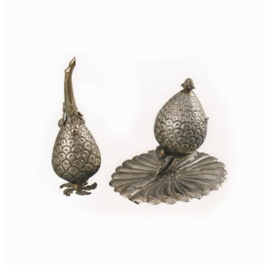
Buhurdan ve Gülabdan Örneđi

Kirdenlik: Bursa yöresinde kildan olarak da adlandırılan kirdenlik, halk arasında hamam kazanı olarak anılmıřtır. apları 17 cm ile 44 cm arasında deđiřmektedir. Dibi geniř, ađzı dar bakır kaplar olan kirdenliklerin kullanım amacı kirli amařırların yıkanmasıdır. Ters evrilerek tabure gibi kullanılmalarının yanı sıra güzel ses verdiđi için eđlencelerde darbuka gibi alınmaları da yaygın kullanım Őekilleri arasındadır. Geometrik, yazılı, bitki desenli ve Őerit bordürlü olanları mevcuttur.