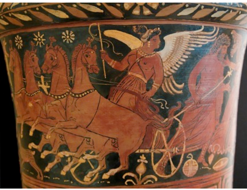
Baltimore ressamı MÖ 340-320 kırmızı figürlü bir lutrophoros

Geç Arkaik Dönem'de (M.Ö. 530-480) insan vücudunun yeni, korkusuz görünüşüyle yapılan deneyler (bazen çok katı perspektifsel küçülmeler) karakteristiktir. Bu, her şeyden önce dönemin arttırılan (yükseltelen) beden hissine uyarı konuların tasviri için gerekliydi: bir taraftan palaestradaki yaşamın (ör. Euphronios'un Berlin'deki kelch-krateri, ca. M.Ö. 510-500, Boardman, RVarchZ Res. 24,1-3) diğer taraftan symposiondan sonra kendinden geçercesine edilen dans tasviri gibi (ör. Eutumides'in Münich'deki amforası, ca. M.Ö. 510-500, Boardman, RVarchZ Res. 33,2). Arkaik Dönem ressamlarının renklere ve gösterişli elbise örneklerine olan ilgileri, geniş ölçüde arka planda ortaya çıkar. Onun yerine çizgiler yardımıyla elbise kıvrımları vurgulanmaya çalışılmıştır. Tamamen ortadan kalmış olan kazıma tekniğinin yerini itinalı kontur çizgileri almıştır.