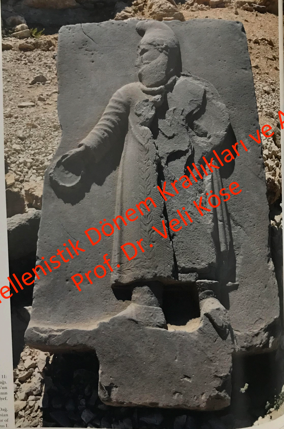
Fig. 11: Nemrud Dağı. I. Antiochos'un Pers atasının betimlendiği rölyef.