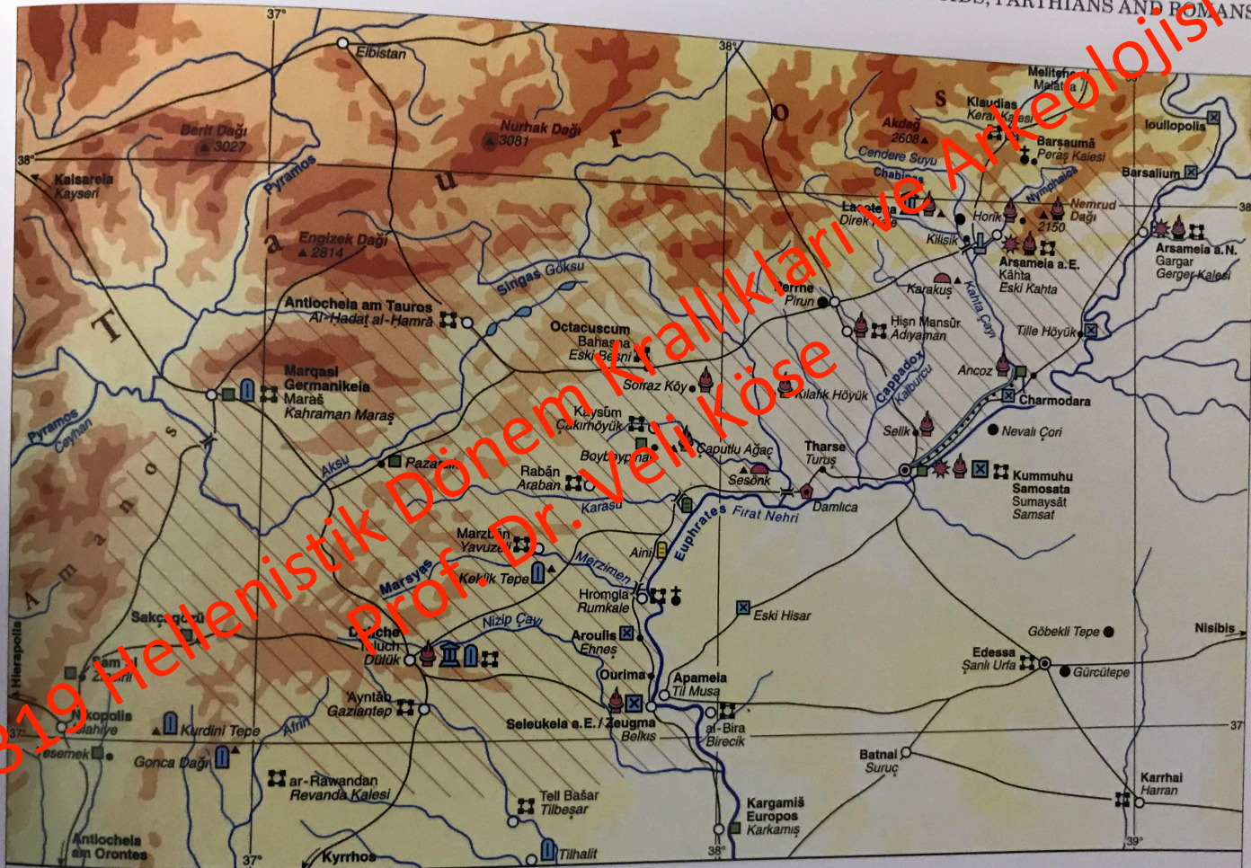
COMMAGENE: BETWEEN SELEUCIDS, PARTHIANS AND ROMANS