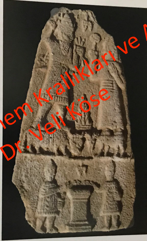
Fig. 20: Dülük Baba Tepesi. Dolikhe Tanrıları Steli. Roma Dönemi.

Dülük Baba Tepesi. Stele of the Gods of Doliche. Roman Period.