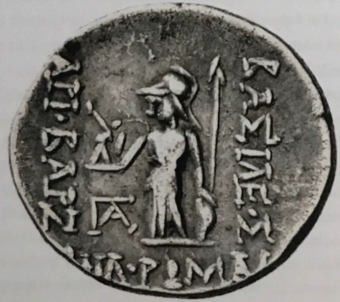
Fig. 3: I. Ariobarzanes Philoromaos gümüş sikkesi. (Busso Peus EA 8, 144)