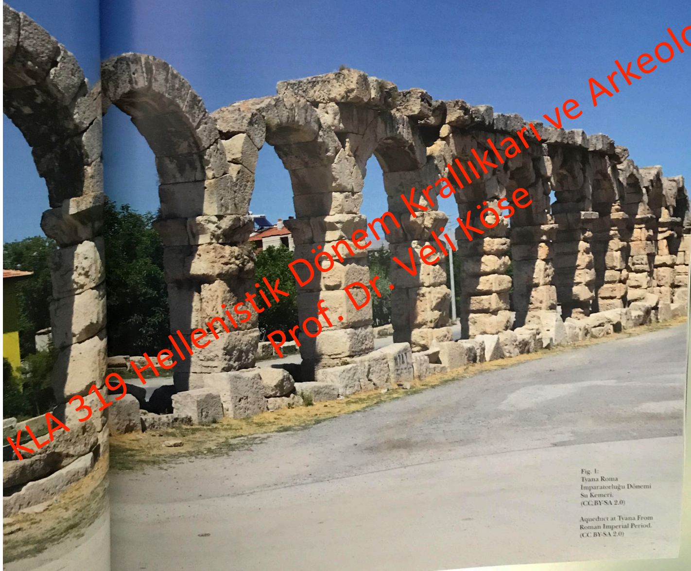
Fig. 1: Tyana Roma İmparatorluğu Dönemi Su Kemeri.