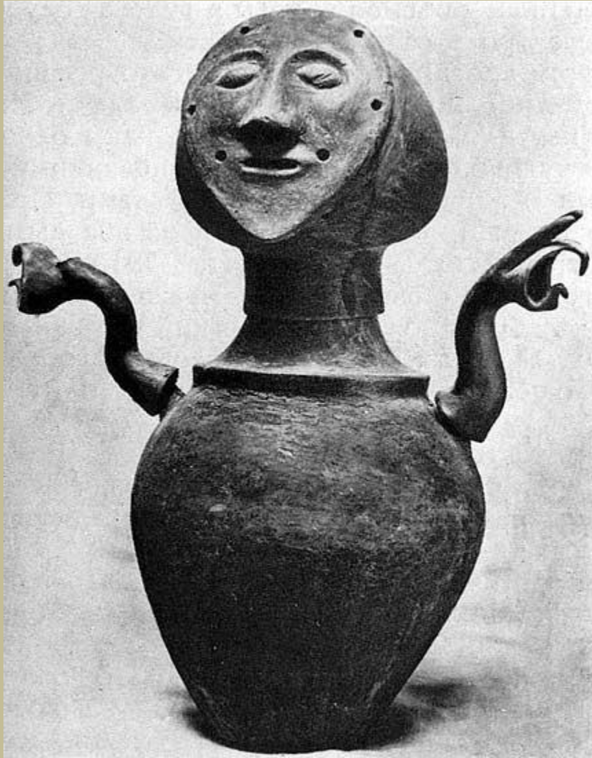
Canope urn with handles. Terracotta. 6th century BCE. Chiusi, National Etruscan Museum