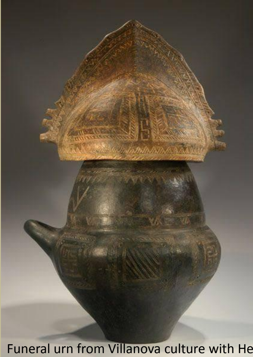
Funeral urn from Villanova culture with Helmet Lid.