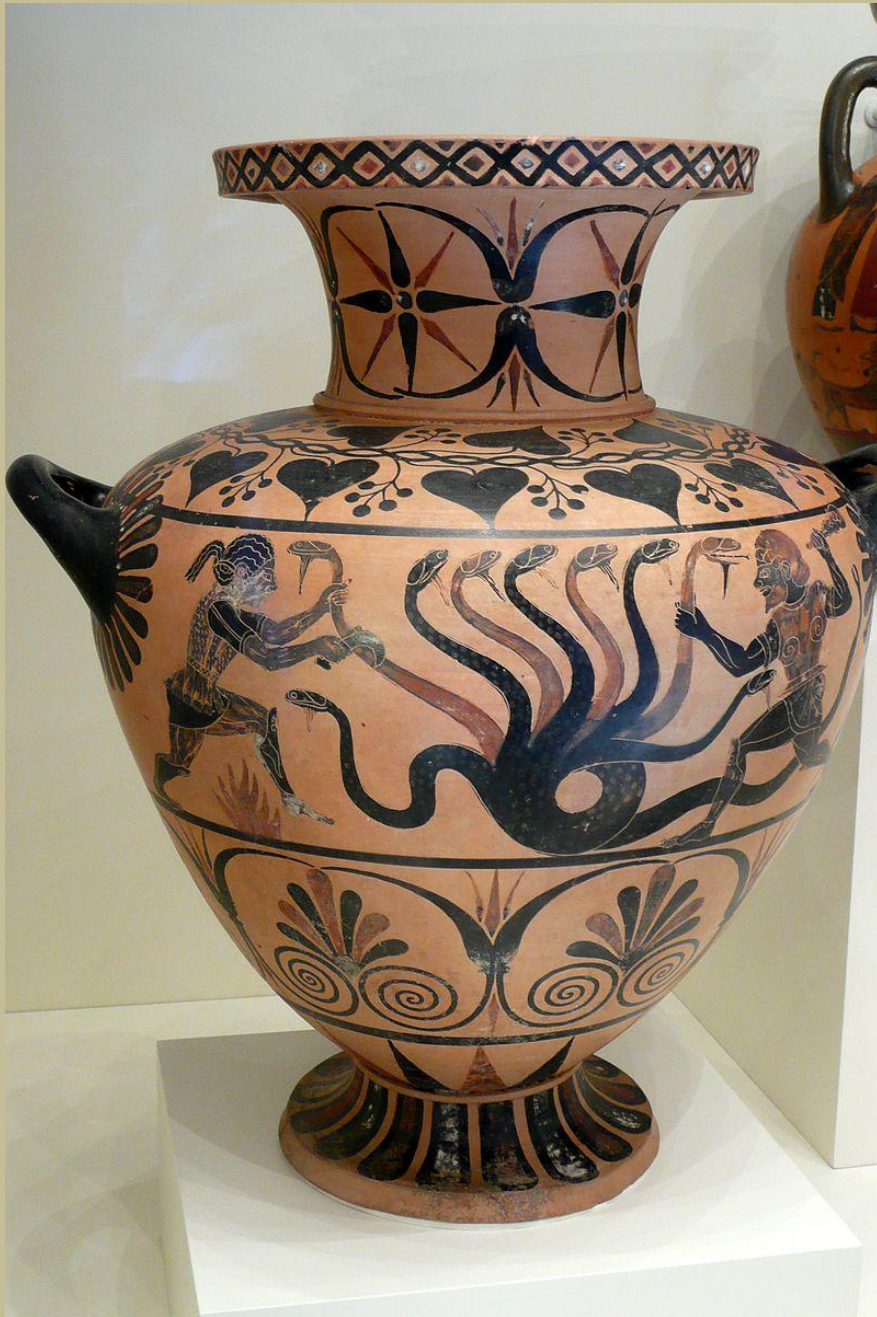
Water jar with Herakles and the Hydra, c. 525 BC