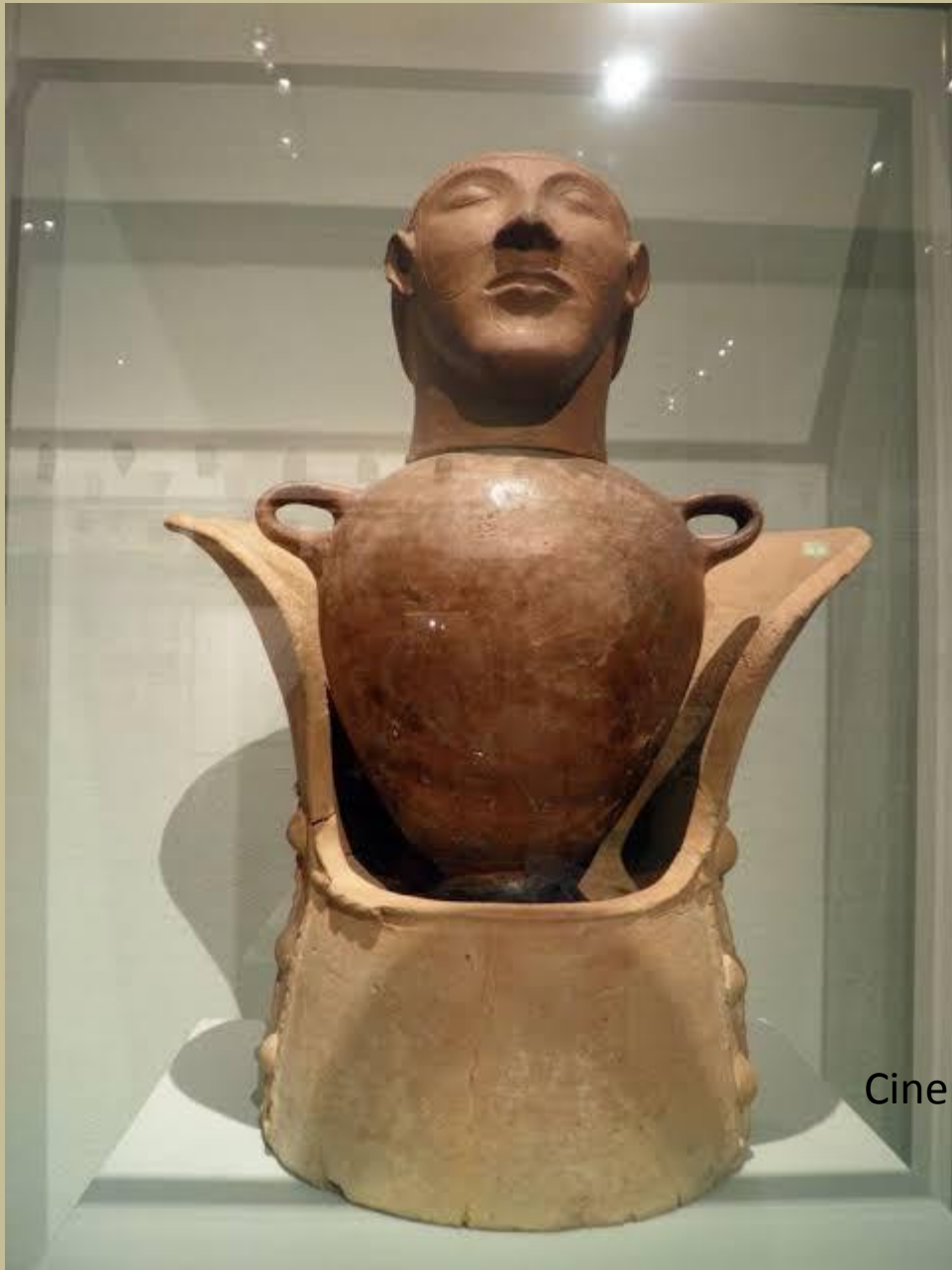
Cinerary Urn in the Shape of Canopus, Italia