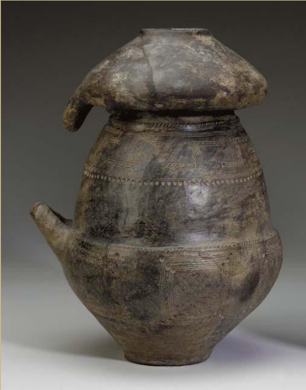
A VILLANOVAN BICONICAL IMPASTO URN AND LID CIRCA 8TH CENTURY B.C.