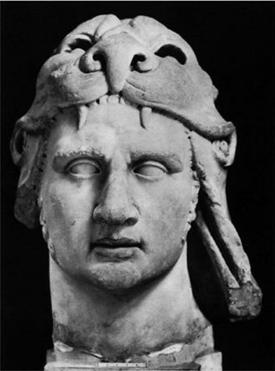
Kral VI. Mithridates