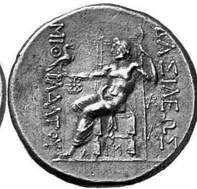
Mithridates III M.Ö.220-185