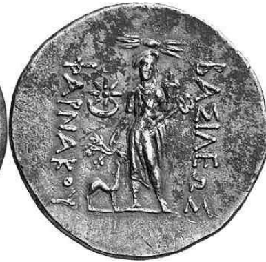
Pharnakes I M.Ö. 185-170