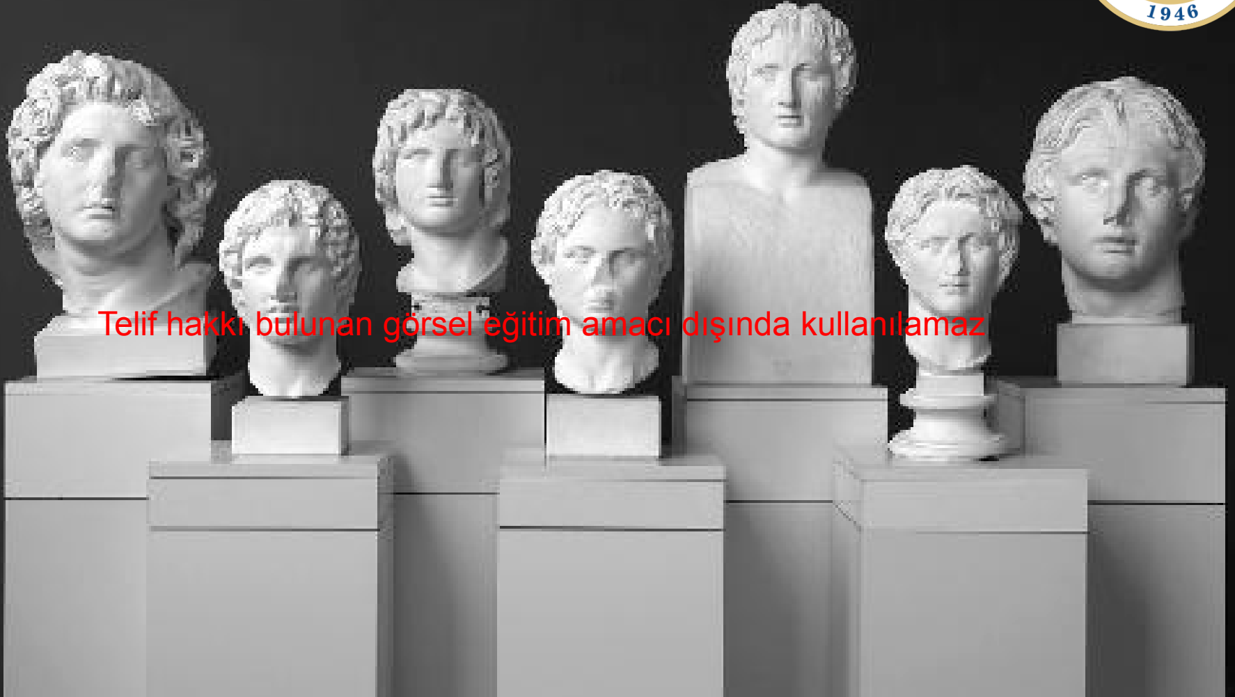
Büyük İskender'in Yedi Portresi