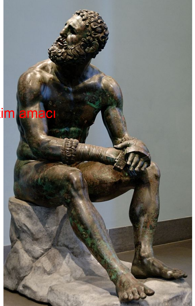
Bronz Dinlenen Boksör Heykeli , Hellenistik , Roma

Telif hakkı bulunan görsel eğitim amacı dışında kullanılamaz