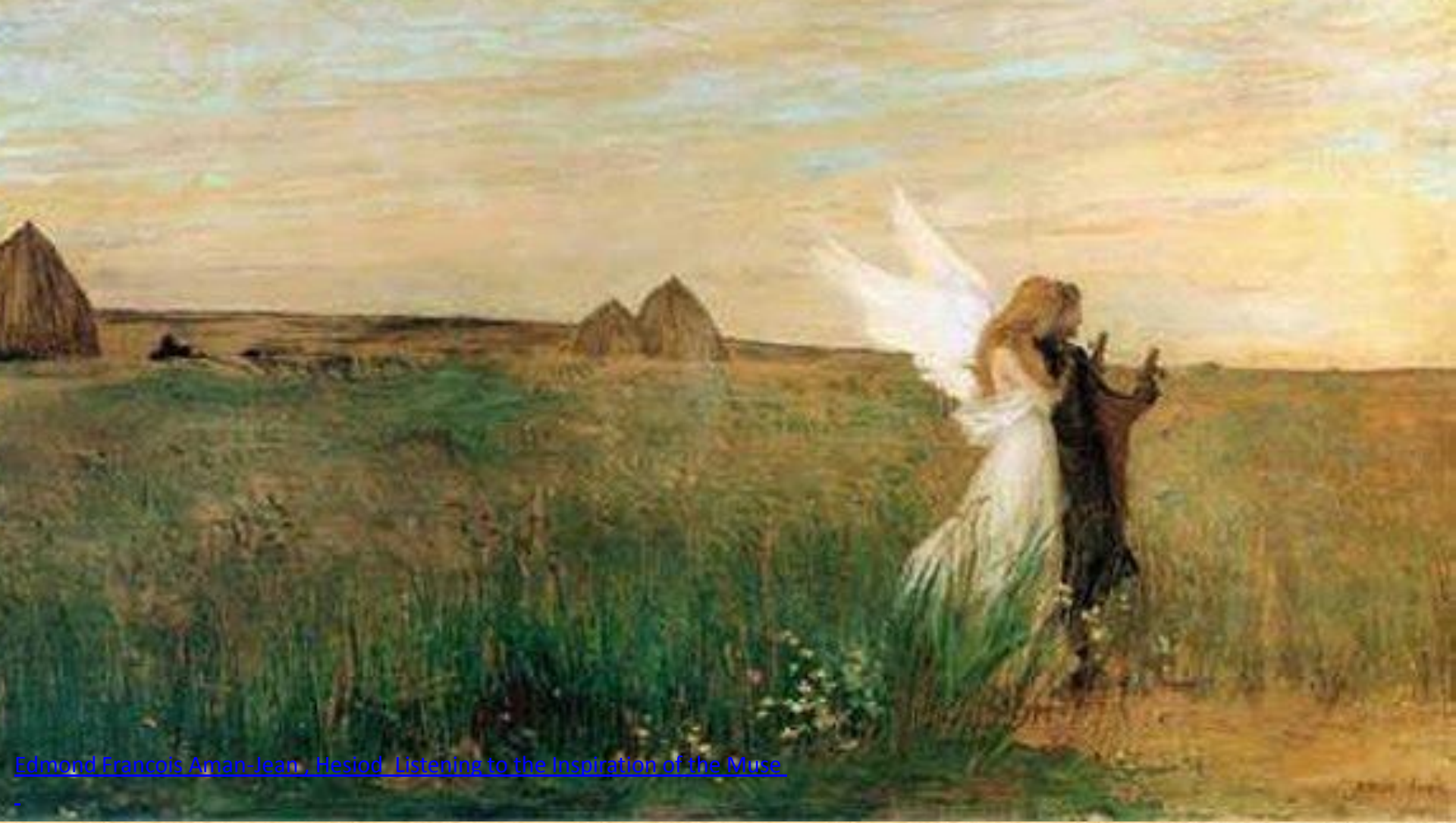
Edmond Francois Aman-Jean , Hesiod Listening to the Inspiration of the Muse