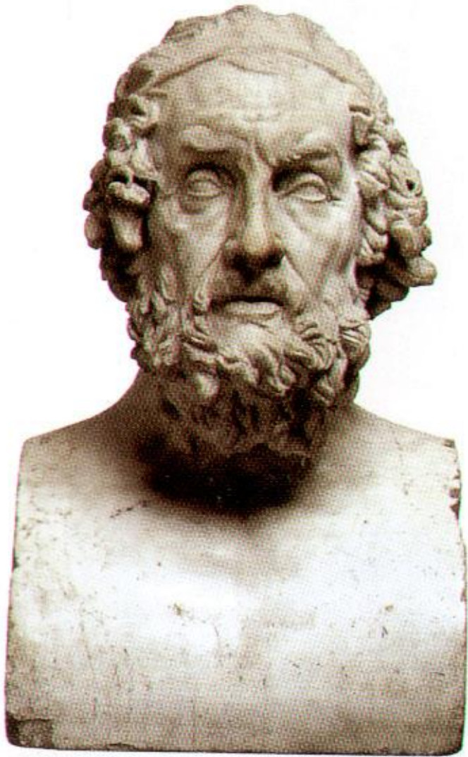
HOMEROS M.Ö.ca 850