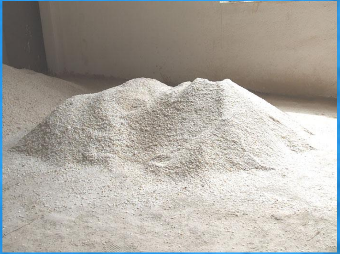
KUVARS KUMU (SİLİCA)