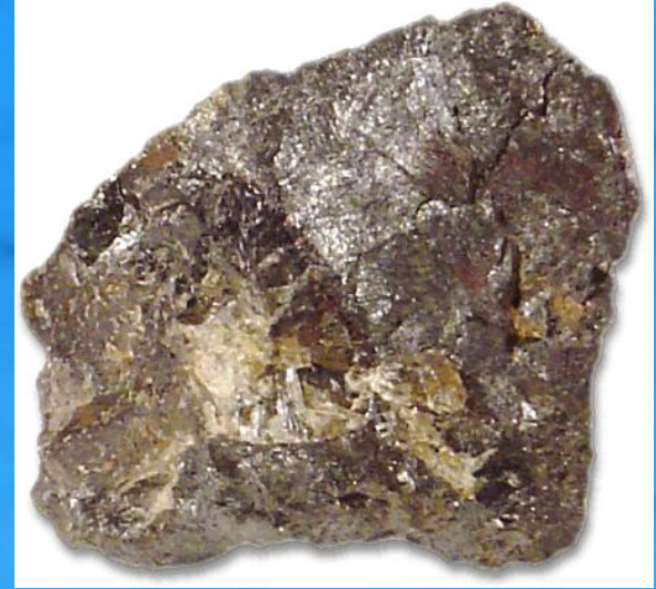
Kurşun - Sarı