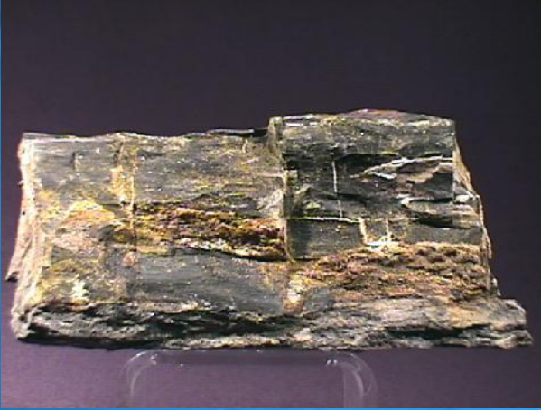
Uranium Oksit - Sarı Yeşil (Parlak)