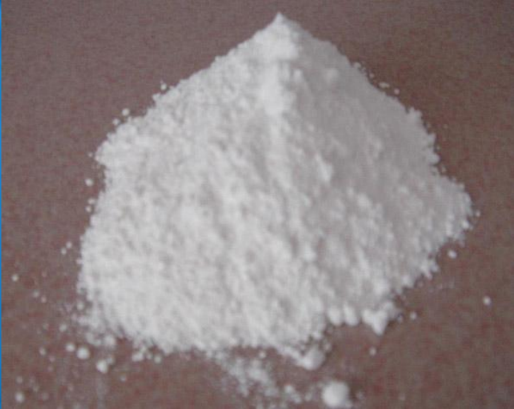
KALSIYUM KARBONAT (KİREÇTAŞI)