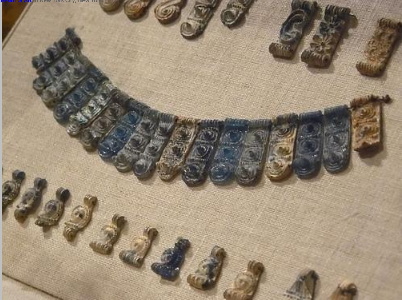
Assortment of glass ornaments Mycenaean Late Helladic IIIA 1400-1200 BCE, Metropolitan Museum