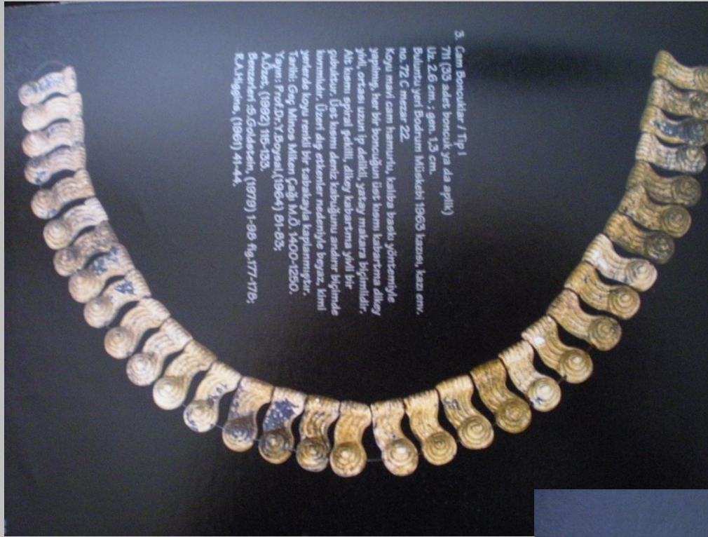
Müsgebi Myken Boncukları (Bodrum Sualtı Arkeoloji Müzesi)