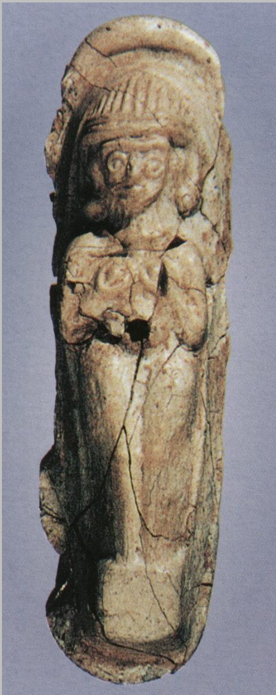
Ishtar (?), Alalakh M.Ö. 1400-1200