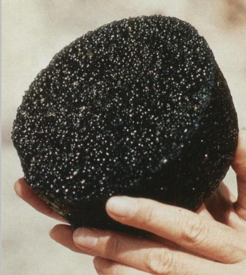
M.Ö. 14.yy. Kas-Uluburun Batığı Cam ingot