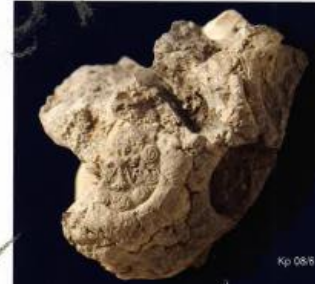
Fig. 9: Çift başlı kartal motifli damga mühür baskılı bulla

Bulla with a seal impression consisting of a double headed eagle motif