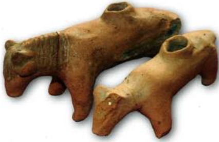
Fig. 6: At figürinleri