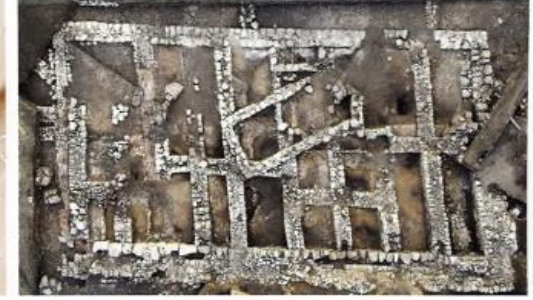
Fig. 1: Kayalıpınar Planı