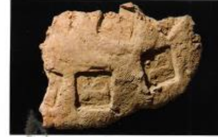
Fig. 8: Antilop motifli mühür baskısı