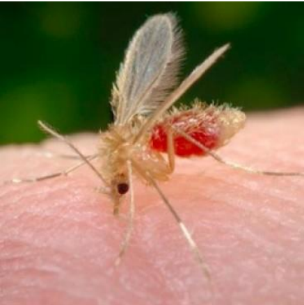
Phlebotomus sp “kıllı kanatlarıyla sivrisineklerden farklı”