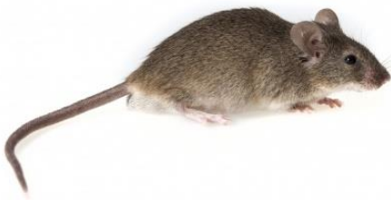
Mus domesticus 'evlerde' / Mus macadenicus 'tarlada'