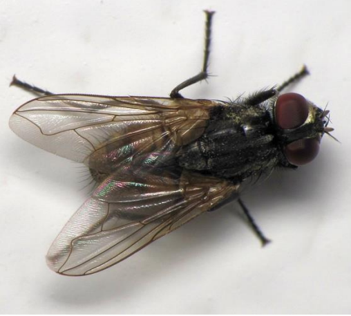
Musca domestica (Paleartikte yayılış yapan diğer bazı türleri; M. autumnalis , M. sorbens )