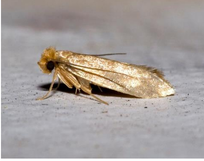
Tineolabisselliella “elbise güvesi”