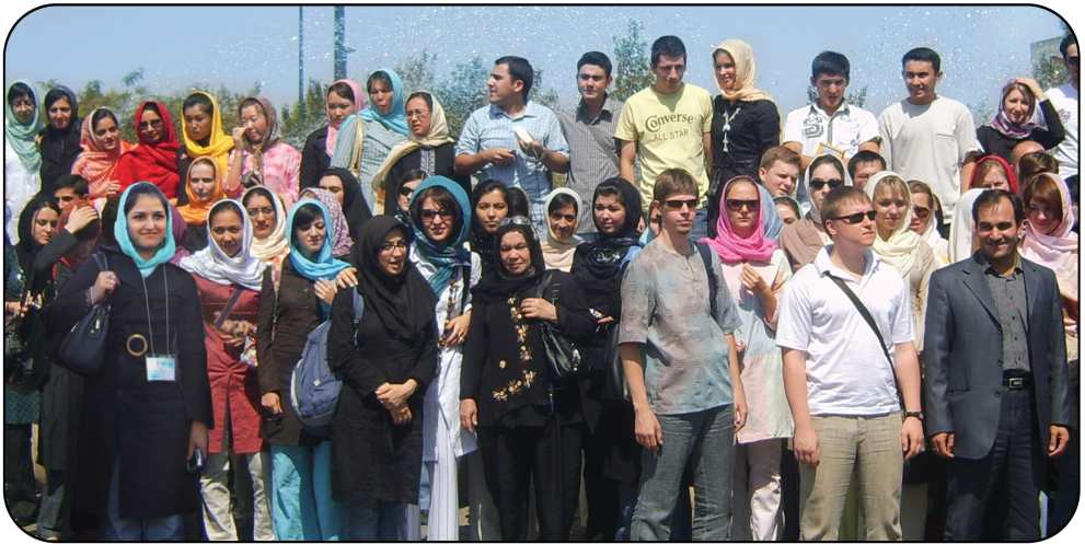
أستاذان و دانشجویان زَبانِ فارسی