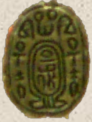
Hyksos Kralı Apophis'e Ait Skarabe

2. Ara Devir, 15. Sülale zamanları, Tel el Yahudiye Seramik Örnekleri, Avaris / Tell Dab'a.