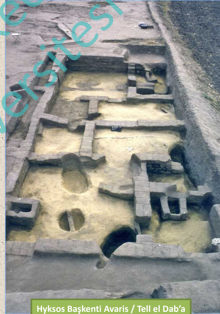
Hyksos Başkenti Avaris / Tell el Dab'a Saray Yapısı

Tel el Dab'a bize Mısır'da Hyksos hakimiyetinden çok önceden beri Suriye – Filistin kökenli insanların yaşamaya başladığını göstermektedir. Tel el Dab'a da görülen Suriye için karakteristik orta salona sahip evler (OTÇ IIA), ev gömüleri ve mabet inşaatları, şehircilik anlayışına sahip farklı kökene sahip insanların burada bulunduğunu kanıtlamaktadır. Hyksoslara özgü bazı seramik ve mimari özellikler, köken olarak Kuzey Suriye'yi işaret etmektedir. Ele geçen ve üzerinde Suriye fırtına tanrısı bulunan bir mühür de bu görüşü desteklemektedir. Burada yaşayan halkın bir kısmı ise ticaretin büyük ölçüde gerçekleştirildiği bölge olan güney Filistin Bölgesinden gelmiş olmalıdır.