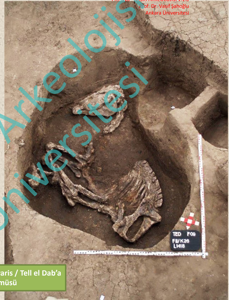
Hyksos Başkenti Avaris / Tell el Dab'a At Gömüsü

Hyksos mezarlarının büyük bir kısmında metal silahlar ve bakır kalıpları ele geçmiş olması, bu insanların büyük bir kısmının askerler ve maden işçilerinden oluştuğunu düşündürmektedir. Mezarlardaki bu savaşçı geleneği Hyksos dönemine kadar devam etmiştir. Mezarların önünde bir çift eşek gömüsü bulunması bu dönemde bu insanların eşek arabaları da kullandıklarına işaret etmektedir.