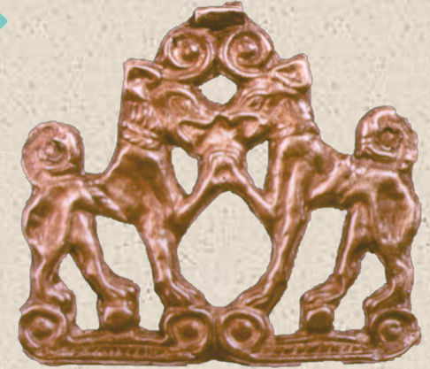
Avaris, Minos stilinde yapılmış bir altın pandantif İkinci Ara Devir.

Avaris'i ele geçiren Ahmose, burayı yenileyerek kendi merkezini buraya kurar. Ahmose'nin yeniden ele alarak düzenlediği bu merkezin mimarisine bakıldığında yapı inşaatının detaylarında önemli Girit Minos etkisi göze çarpar. Bunun yanında Minos stilinde duvar boyaları, boğa akrobasi, boğa tutma, av sahneleri, akrobatlar ve grifonlar gibi sahneler karşımıza çıkar. Özellikle Knossos sarayı ile benzerlikler yansıtan bu düzenlemeler, bu dönemde deniz hakimiyeti oldukça zayıf olan Mısır'ın, dönemin en önemli deniz gücü olan Girit – Minos kültürü ile olan yakın bağlarına işaret etmektedir. Mısırlılar büyük ihtimalle denizlerin hakimi olan Minoslularla bir ittifak halinde olarak denizleri de kontrollerinde tutmayı denemişlerdir.