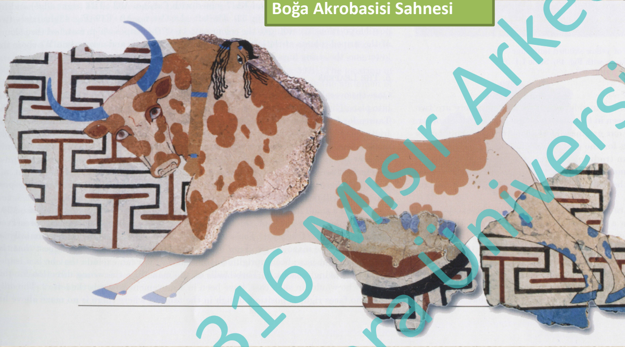
Tell el Dab'a Minos Stilinde Duvar Boyası Boğa Akrobasisi Sahnesi