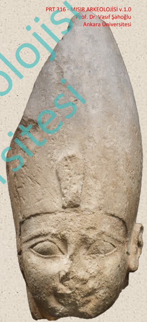
Ahmose'ye ait Heykel Baş Kireçtaşı

Bu kral aynı zamanda 18. sülalenin de başlangıcını oluşturmaktadır. Bu sülalenin başlamasıyla birlikte Yeni Krallık Dönemi de başlamış olmaktadır.