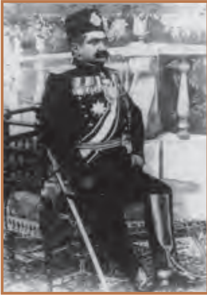
مسعود میرزا ظل‌السلطان پسر بزرگ ناصرالدین‌شاه که ۳۴ سال متوالی حاکم اصفهان و قریب ۴۵ سال به طور متناوب حاکم مازندران و اصفهان و فارس بود.