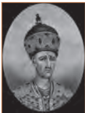
آقا محمدخان قاجار

آقامحمدخان پسر بزرگ محمدحسن خان بود. او بعد از مرگ پدر، به عنوان گروگان در شیراز به سر می برد. مرگ کریم خان زند، فرصتی را در اختیارش نهاد که خود را به استرآباد برساند و با متحد کردن ایل قاجار، آماده رویارویی با خاندان زندیه گردد. نزاع بازماندگان کریم خان با یکدیگر این فرصت را برای آقامحمدخان فراهم آورد که نواحی شمالی و مرکزی ایران را تصرف کند و تهران را به عنوان مرکز فرمانروایی خویش، برگزیند. خان قاجار پس از پیروزی