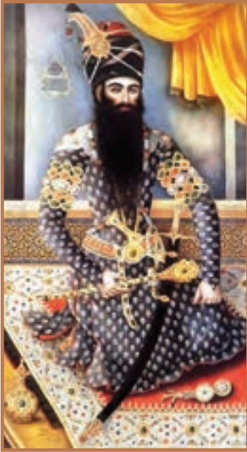
فتحعلی شاه قاجار

بعد از مرگ آقامحمدخان، برادرزاده وی، به کمک سران نظامی و بزرگان قاجار، به نام فتحعلی شاه تاج گذاری کرد. سال های نخست سلطنت فتحعلی شاه صرف سرکوب طغیان های داخلی و تحکیم پادشاهی در خاندان قاجار شد. تغییر اوضاع جهانی و تشدید تکاپوهای استعماری سبب شد تا دومین شاه قاجار در مقابله با دشمنان خارجی و حفظ قلمرو ایران ناکام باشد. سهل انگاری در اداره کشور و واگذاری بخش هایی از ایران به بیگانگان سبب شده است که قضاوت عمومی نسبت به او با نوعی احساس تنفر همراه باشد. تقریباً همه منابع و تحقیقات تاریخی از دوران سلطنت وی به تلخی یاد می کنند. البته این سخن به معنای آن نیست که فتحعلی شاه، هیچ تلاشی برای حفظ یکپارچگی ایران انجام نداد و به عمد زمینه مداخله و حضور بیگانگان را در کشور فراهم کرد؛ بلکه می توان گفت که با وجود خواست عمومی و