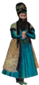
میرزا ابوالقاسم قائم مقام فراهانی

قائم مقام مردی فوق العاده باهوش و صاحب فکر و عزم ثابت بود. او به واسطه اطلاعات و تجارب خود، اوضاع و احوال همسایگان ایران و دولت های اروپایی را به خوبی می شناخت. دولت های استعمارگر اطمینان داشتند که او مانع جدی برای توسعه نفوذ و دخالت آنان در ایران است. از این رو، نویسندگان انگلیسی که در آن تاریخ در ایران سیاحت می کردند، قائم مقام را به سرپیچی از نصایح دولت انگلستان و طرح نقشه تصرف هرات متهم می کنند و حس بدبینی و دشمنی فوق العاده خود را نسبت به این مرد بزرگ، پنهان نمی کنند. او نمونه بارز تدبیر و تیزبینی آمیخته با انسان دوستی میهن پرستانه بود که در آن شرایط می توانست ایران را به خوبی اداره کند.