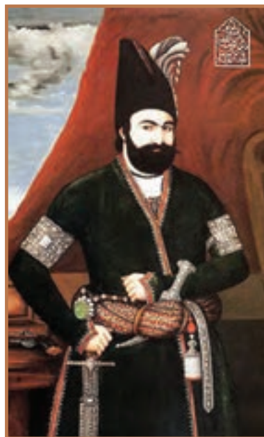
محمد شاه قاجار

فتحعلی شاه در زمان حیات خویش عباس میرزا را به عنوان ولیعهد خود معرفی کرده بود، اما مرگ ناگهانی این شاهزاده لایق باعث شد تا مقام ولیعهدی به فرزند وی، محمدمیرزا برسد. بعد از مرگ فتحعلی شاه، محمدمیرزا به کمک میرزا ابوالقاسم قائم مقام فراهانی بر مسند پادشاهی تکیه زد. قائم مقام فراهانی به منصب صدارت منصوب شد. او با تدبیر، مدعیان تاج و تخت را به جای خود نشاند و اوضاع اجتماعی و فرهنگی را بهبود بخشید. ایستادگی وی در برابر دخالت و زیاده خواهی های دولت انگلستان، موجب شد که سفیر و عوامل داخلی آن کشور علیه آن وزیر ادیب دسیسه کنند و موجبات برکناری و قتل وی را فراهم آورند.