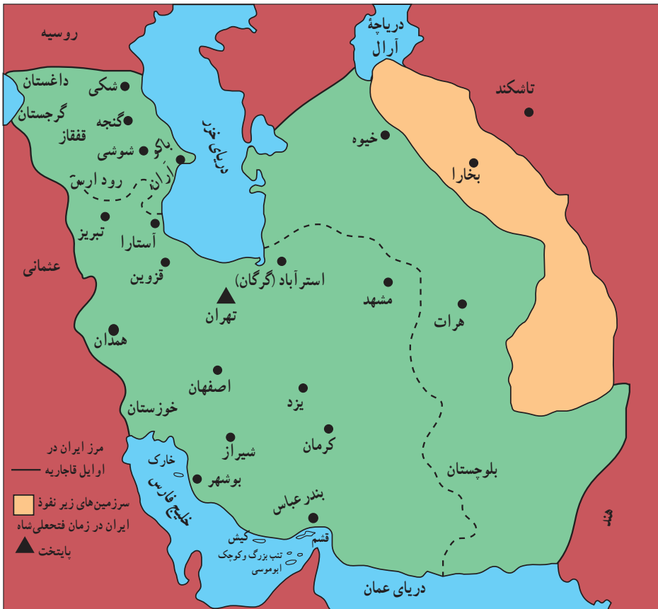
قلمرو ایران (در اوایل قاجاریه)

آقامحمدخان در سال ۱۲۱۱ ق/ ۱۷۵۵ ش. بار دیگر برای برقراری نظم و امنیت عازم قفقاز شد، اما در جریان لشکرکشی به آن منطقه توسط چند تن از همراهان خویش به قتل رسید. بدون تردید تلاش و تکاپوهای بی‌وقفهٔ آقامحمدخان قاجار برای اعادهٔ حاکمیت دولت مرکزی بر سرتاسر قلمرو ایران و ایجاد یکپارچگی سیاسی، قابل تمجید است، اما از طرف دیگر بی‌رحمی و کینه‌توزی و قساوت قلب وی که ریشه در حوادث زمان کودکی و نوجوانی او داشت، سبب شده است که در تاریخ ایران از وی به نیکی یاد نشود.