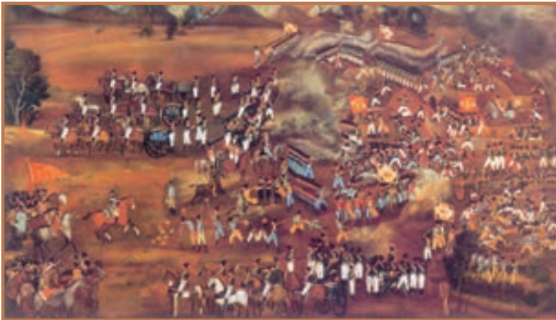
یک نقاشی از صحنه جنگ ایران و روسیه

داد، روس‌ها نیروهای نظامی خود را به منطقه قفقاز اعزام و گرجستان را تصرف کردند. تهاجم نظامی روسیه به این منطقه که اهمیت حیاتی برای ایران داشت، باعث بروز دو دوره جنگ، میان دو کشور شد. ۱- دور اول جنگ‌های ایران و روسیه : دور اول جنگ‌های ایران و روسیه که نزدیک به ۱۰ سال طول کشید ۱ ، در نهایت به سبب ضعف سیاسی و نظامی ایران، به پیروزی روسیه انجامید و حکومت قاجار مجبور به امضای قرارداد گلستان شد. طبق مفاد آن قرارداد، نه تنها بخش‌هایی از نواحی شمالی میهن ما، شامل ولایات گرجستان، داغستان و اران و شهرهایی چون تفلیس، دربند، باکو، گنجه، شکی، شیروان و ... به روسیه واگذار گردید، بلکه ایران از داشتن نیروی دریایی در دریای خزر نیز محروم شد.