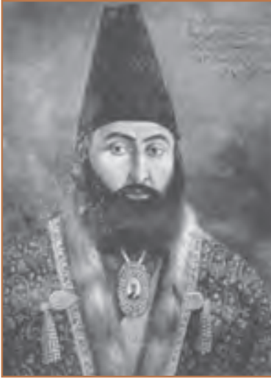
میرزا تقی خان امیرکبیر

با مرگ محمد شاه، ولیعهد او ناصرالدین میرزا با حمایت میرزاتقی خان فراهانی به عنوان چهارمین پادشاه قاجار بر تخت سلطنت نشست. میرزاتقی خان به مقام صدراعظمی منصوب و به امیرکبیر ملقب شد. صدراعظم ابتدا به سرکشی و طغیان گردنکشان داخلی پایان داد و نظم و امنیت را برقرار کرد. او سپس بر پایه شناختی که از دیگر کشورها داشت، برنامه منسجمی را با هدف اصلاح امور و جبران عقب ماندگی ایران طراحی کرد و به اجرا گذاشت. اصلاحات مورد نظر امیرکبیر به سرانجام مطلوب نرسید؛ زیرا مدتی بعد قربانی توطئه درباریان نالایق و طماع و دسیسه‌های روسیه و انگلستان شد. ناصرالدین شاه با وجود علاقه‌ای که به وزیرش داشت، تحت تأثیر دشمنان امیرکبیر، فرمان برکناری، تبعید و سرانجام قتل او را صادر کرد.