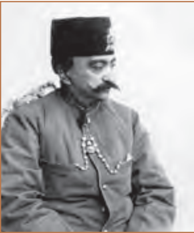
ناصرالدین شاه قاجار

با مرگ محمد شاه، ولیعهد او ناصرالدین میرزا با حمایت میرزاتقی خان فراهانی به عنوان چهارمین پادشاه قاجار بر تخت سلطنت نشست. میرزاتقی خان به مقام صدراعظمی منصوب و به امیرکبیر ملقب شد. صدراعظم ابتدا به سرکشی و طغیان گردنکشان داخلی پایان داد و نظم و امنیت را برقرار کرد. او سپس بر پایه شناختی که از دیگر کشورها داشت، برنامه منسجمی را با هدف اصلاح امور و جبران عقب ماندگی ایران طراحی کرد و به اجرا گذاشت. اصلاحات مورد نظر امیرکبیر به سرانجام مطلوب نرسید؛ زیرا مدتی بعد قربانی توطئه درباریان نالایق و طماع و دسیسه‌های روسیه و انگلستان شد. ناصرالدین شاه با وجود علاقه‌ای که به وزیرش داشت، تحت تأثیر دشمنان امیرکبیر، فرمان برکناری، تبعید و سرانجام قتل او را صادر کرد.