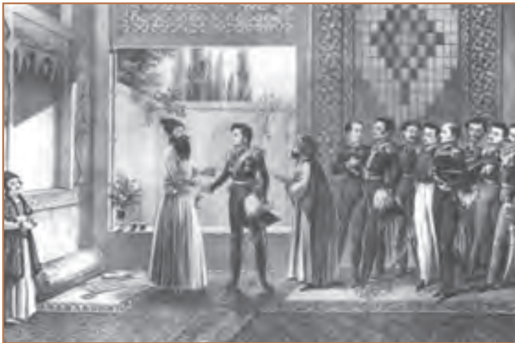
ملاقات عباس میرزا با فرمانده نیروهای روسیه

به موجب عهدنامه ترکمانچای، افزودن بر مناطق و شهرهایی که در عهدنامه گلستان از ایران جدا شده بودند، شهرهای ایروان و نخجوان و بخشی از دشت مغان نیز به روسیه داده شد. همچنین ایران متعهد شد که ۵ میلیون تومان غرامت به روسیه پرداخت کند و به اتباع آن کشور در ایران، حق مصونیت قضایی (کاپیتولاسیون) ۲ بدهد. علاوه بر آن، روس‌ها یک قرارداد تجاری را نیز ضمیمه عهدنامه ترکمانچای کردند که اقتصاد و بازار ایران را عملاً در اختیار آنان قرار می‌داد.