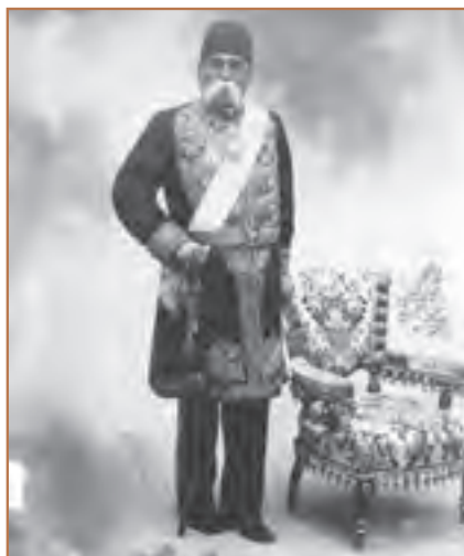
عبدالمجید میرزا عین‌الدوله

اخبار به او برسد. گاهی هم که خبرهایی از نارضایتی مردم به او می‌رسید، به دادن بعضی وعده‌ها به مردم بسنده می‌کرد. عین‌الدوله که صدراعظم و داماد شاه بود، اعتقاد داشت که نباید به اعتراض‌های مردم توجه کرد. سرانجام، رفتارهای او وقوع انقلاب را اجتناب‌ناپذیر کرد. در ابتدا، چند حادثه که متأثر از زمینه‌ها و انگیزه‌های دینی بود، اتفاق افتاد اما برخورد استبدادی صدراعظم و دیگر عاملان حکومت، موجب گسترش این حوادث و فراگیر شدن حرکت مردم از سال ۱۳۲۳ق. / ۱۲۸۴ش. شد.