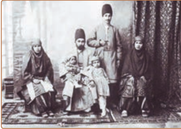
خانواده‌ای زرتشتی در دوره قاجار

در رأس نهاد روحانیت، مجتهدان قرار داشتند که قدرت معنوی و نفوذ اجتماعی آنان حتی از پادشاهان قاجار نیز برتر بود. آنان در مقابل ظلم و ستم مأموران حکومتی از مردم دفاع می‌کردند و منزلشان پناهگاه افراد مظلوم و بی‌پناه بود. از مجتهدان معروف این دوره می‌توان میرزا ابوالقاسم قمی، میرزا محمد علی بهبهانی و میرزا حسن آشتیانی را نام برد.