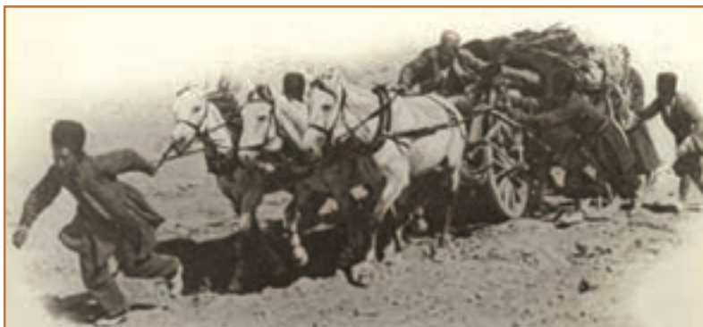
حمل و نقل در عصر قاجار