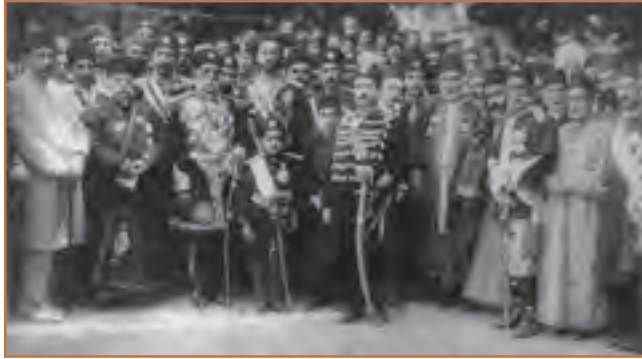
محمدعلی شاه و جمعی از رجال و درباریان هنگام استقرار در باغشاه

به نظر شما، موافقت اولیه محمدعلی شاه با مشروطیت و مخالفت وی با آن پس از رسیدن به سلطنت، چه دلایلی داشت؟