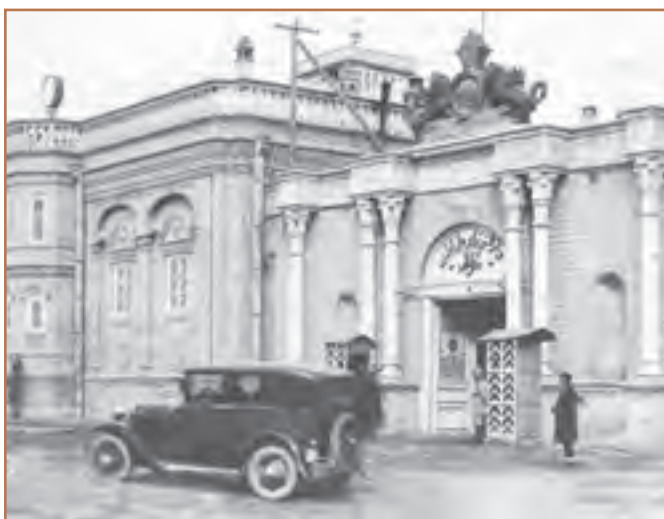
ساختمان مجلس شورای ملی (میدان بهارستان)