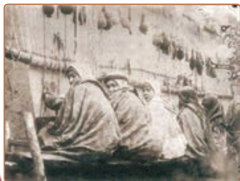
رونق صنعت قالی‌بافی در دوره قاجار

قالیچه ابریشمی نفیس بافت کاشان متعلق به دوره قاجار