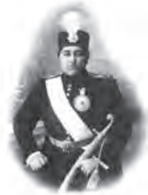
احمدشاه در جوانی

بعد از پناهنده شدن محمد علی شاه به سفارت روسیه، فاتحان تهران و سران مشروطه در میدان بهارستان تهران اجتماع بزرگی تشکیل دادند و برای اداره موقت کشور، ۲۲ نفر را به عنوان «هیئت مدیره» برگزیدند. یکی از اقدامات فاتحان تهران، انتصاب احمد میرزا، فرزند خردسال محمد علی شاه به سلطنت بود. چون احمد شاه در هنگام انتصاب به سلطنت هنوز به سن بلوغ نرسیده بود، عضدالملک رئیس ایل قاجار به نیابت سلطنت منصوب شد؛ بنابراین، احمد شاه در پنج سال اول سلطنت خود فقط اسم پادشاه را داشت و پس از آن هم به دلیل کم تجربه‌گی نتوانست بر اوضاع کشور مسلط شود.