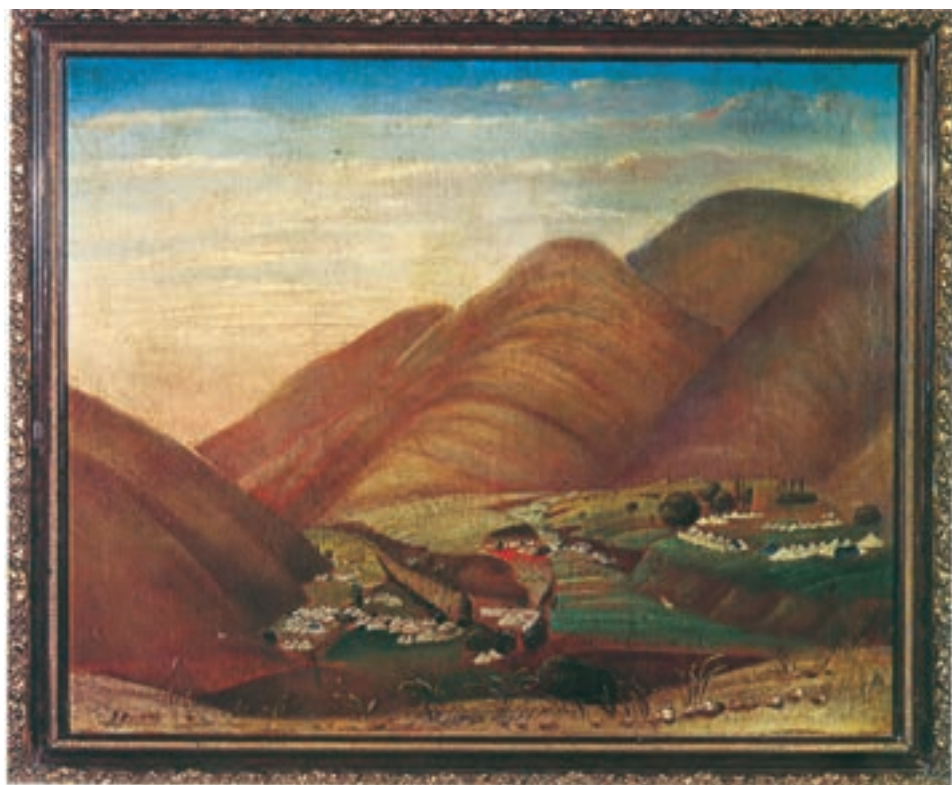
تابلوی رنگ روغن، اردوگاه، مبارک آباد تهران اثر محمد غفاری (کمال الملک)، سال ۱۲۹۱ ق.

داشت و به همین دلیل شاعران بزرگی در دورهٔ پادشاهی وی به شعر فارسی غنا بخشیدند. قائم مقام فراهانی وزیر محمدشاه نیز ادیب و نویسنده‌ای زبردست بود. تاریخ‌نویسی نیز در این دوره رونق داشت و مورخان مشهوری مانند محمدتقی خان لسان‌الملک سپهر، رضا قلی خان هدایت و محمد حسن خان اعتمادالسلطنه آثار ارزشمندی به وجود آوردند. هنر نقاشی و معماری نیز با تأثیرپذیری از دوره‌های قبل و هنر اروپایی به حیات خود ادامه داد. میرزا محمد خان غفاری، ملقب به کمال الملک نقاش مشهور عصر ناصرالدین شاه و مظفرالدین شاه، هنر نقاشی ایران را به اوج کمال و شکوفایی رساند.