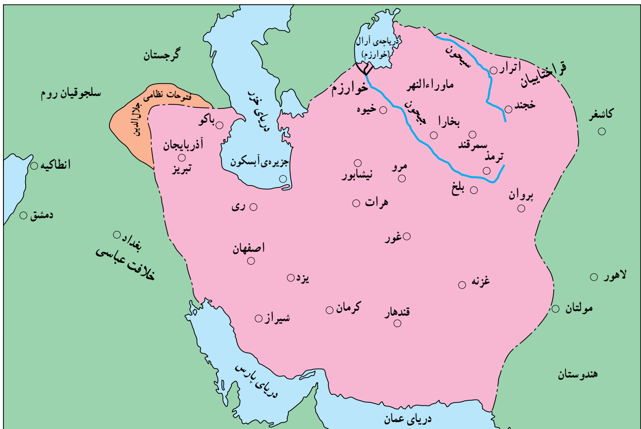
قلمرو خوارزمشاهیان (سلطان محمد خوارزمشاه)

سلطان محمد خوارزمشاه، فرزند و جانشین تکش، راه پدر را در گسترش قلمرو و تثبیت حکومت خوارزمشاهی