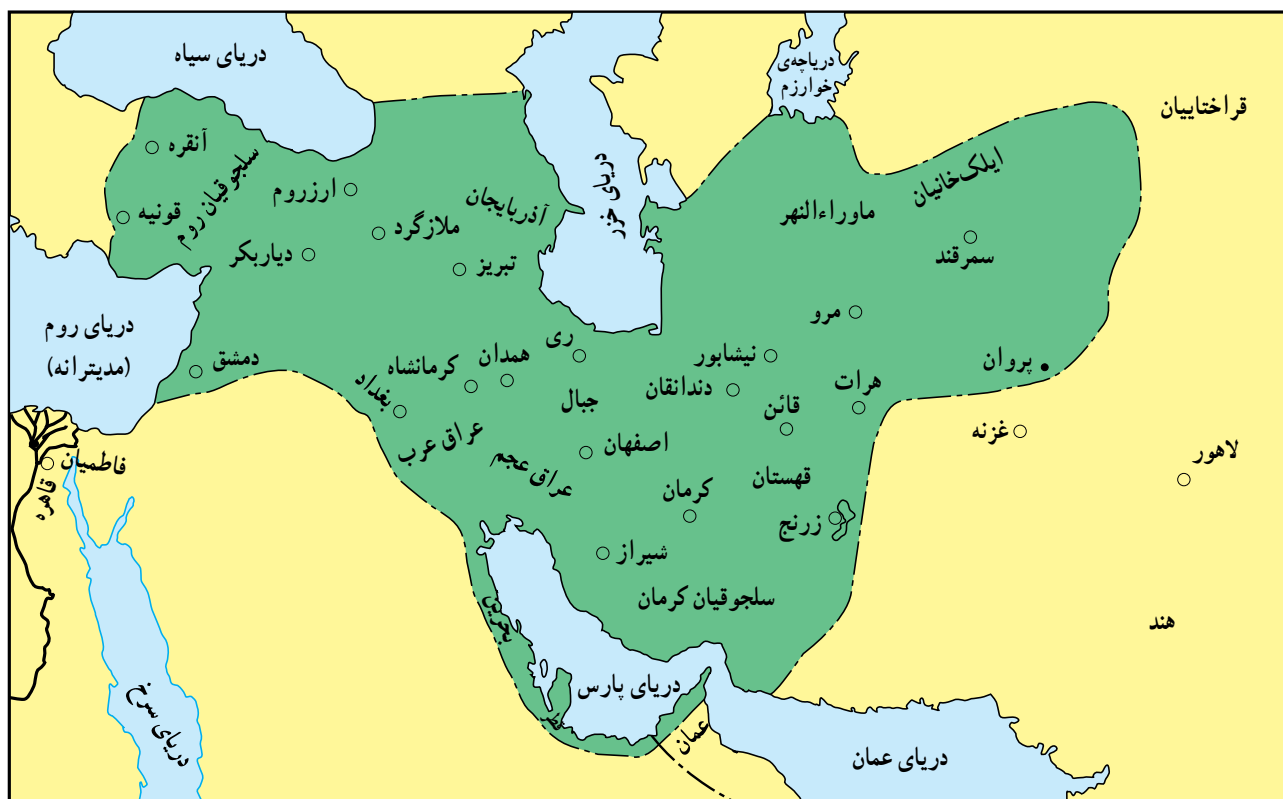
قلمرو سلجوقیان در زمان ملکشاه

از جمله رویدادهای مهم زمان ملکشاه، رویارویی او با خلفای عباسی بود. سلجوقیان که خود را منجی خلافت عباسی از سلطه‌ی آل بویه می‌دانستند، خواهان همراهی کامل خلفا با سیاست‌های خود بودند. مخالفت عباسیان با این کار، ملکشاه را به فکر حمله به بغداد انداخت اما در این زمینه توفیقی نیافت.