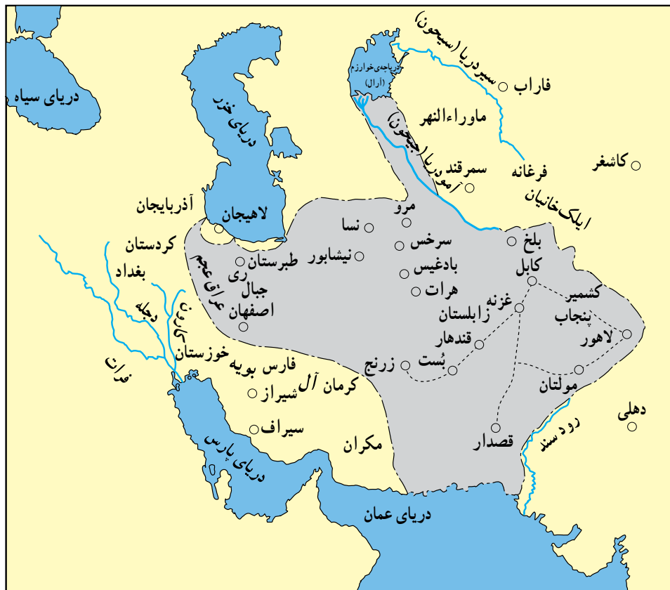
قلمرو غزنویان در زمان سلطان محمود

حملات غزنویان به هند پی آمدهای مختلفی داشت : حکومت غزنوی بود، این زبان به هند نیز راه یافت ؛ سوم نخست آن که موجب شد راه برای گسترش اسلام در آن جا گشوده شود ؛ دوم آن که چون زبان فارسی، زبان رسمی شدن زمینه برای لشکرکشی های بعدی به آن جا شد.