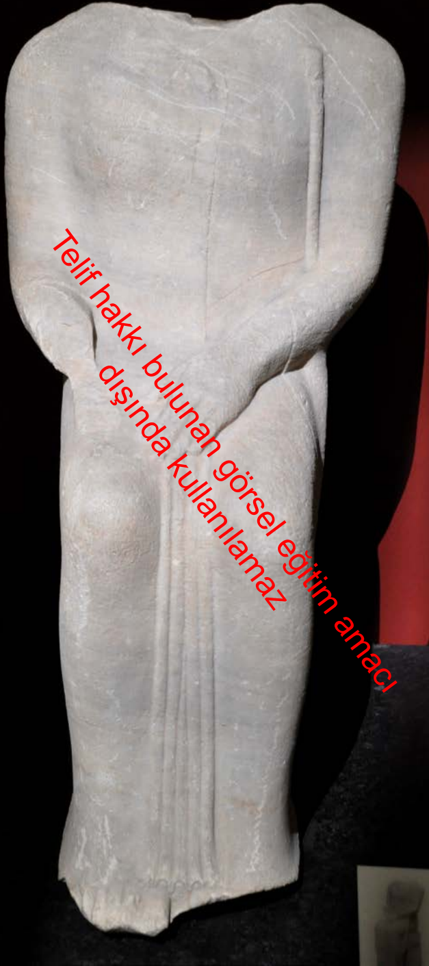
Oturan Rahip Heykeli Miletos-Didymaion İstanbul Arkeoloji Müzesi MÖ 6. yüzyıl ortası