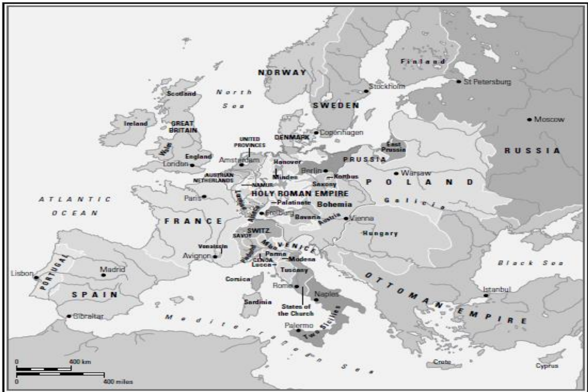
Map 7.2. Europe in 1721, after the treaties of Utrecht and Nystad