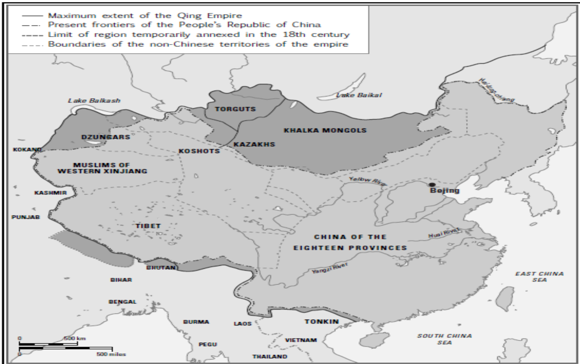
Map 7.1. The Qing Empire