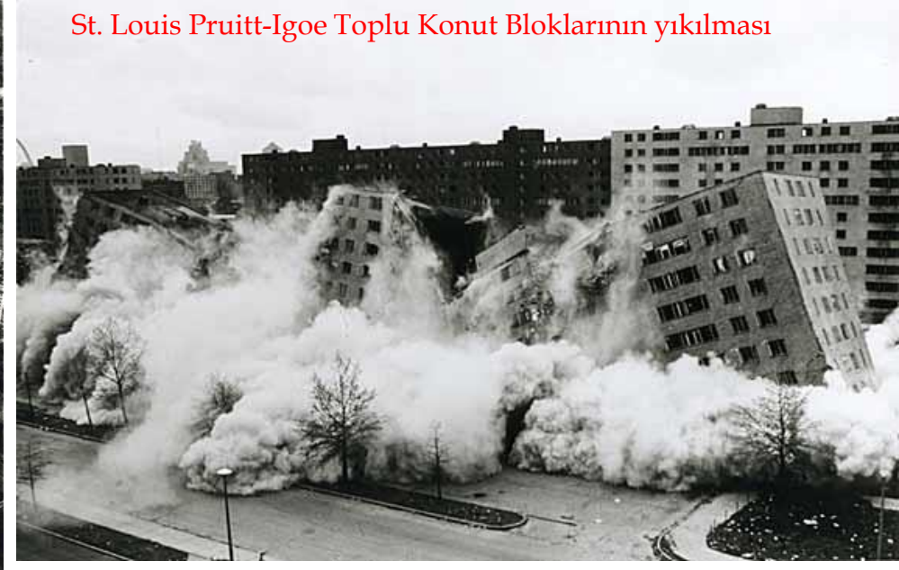
St. Louis Pruitt-Igoe Toplu Konut Bloklarının yıkılması