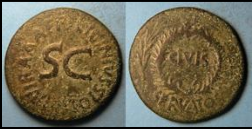
Augustus AE sestertius. OB CIVIS SERVATOS, oak wreath between two branches. Q AELIUS L F LAMIA III VIR A A A F F around large SC.

Augustus Dönemi'nde düşük değerli bir ufak değişim aracına artan talep > Bornz (AE) sestertii ve dupondiis ve onun saf bakırdan üretilmiş alt birimlerine nazaran daha iyi bir görünüme ve değere sahip birimleri piyasaya sürmüştür.