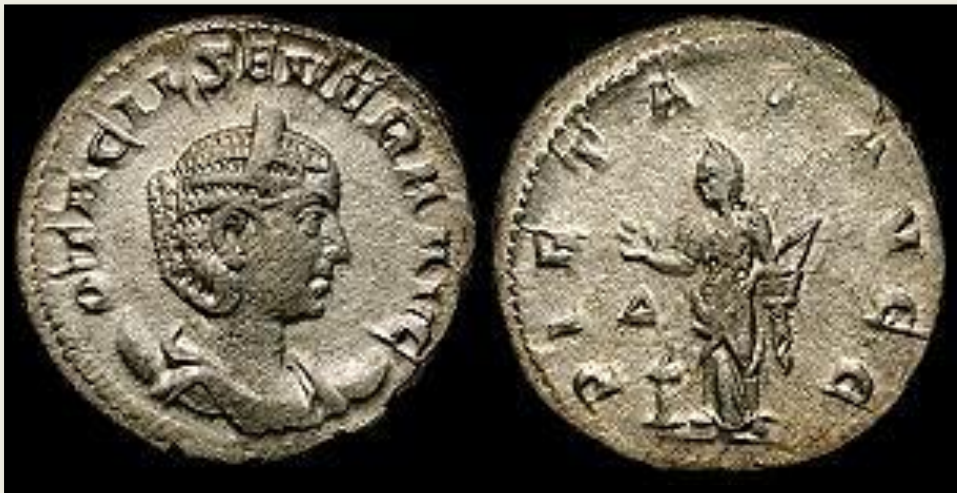
Otacilia Severa – İ.S. 248 Rome Officina Δ (#4)

İ.Ö. 4 yılından itibaren sikkeler üzerinde monetales sayısını bildiren lejandlara artık rastlanmamaktadır.