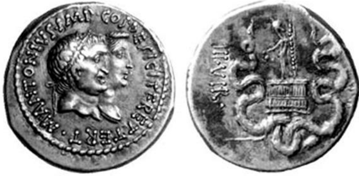
Kistophoros = 3 denarii; 2.8 cm, 10.1-10.5 gr