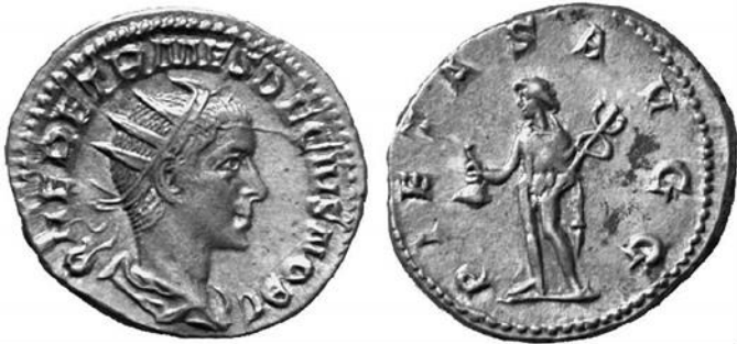
Antoninianus = 2 denari