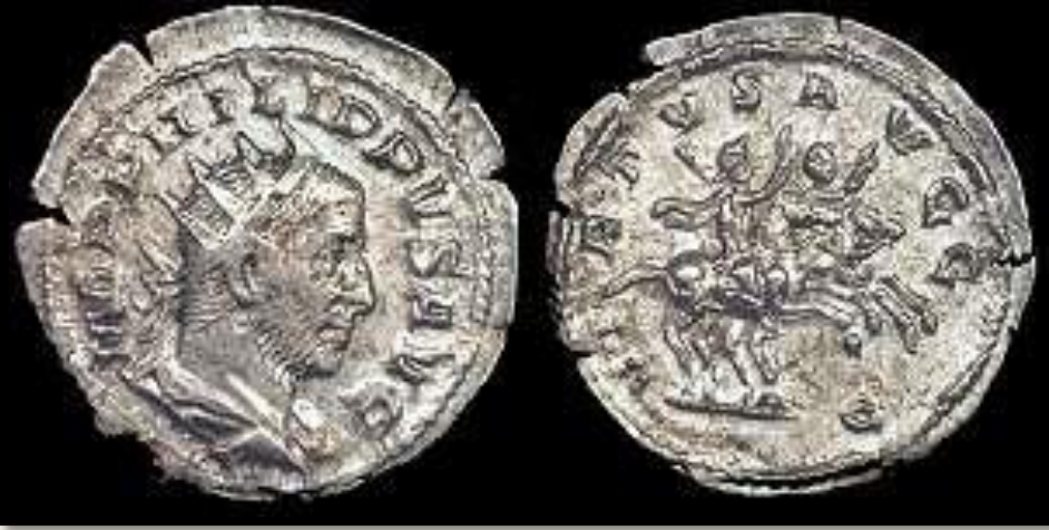
I Philipus – İ.S. 248 Rome Officina E (#5)