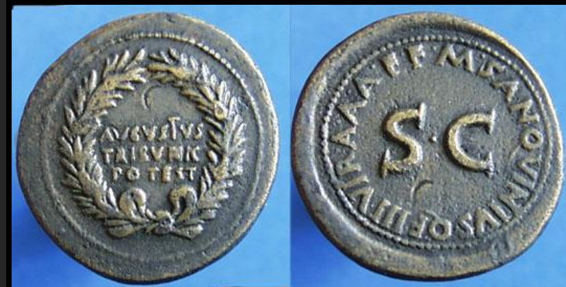
Augustus AE Dupondius. AVGVSTVS TRIBVNIC POTEST çelenk içinde/ M SANQVINIVS QF III VIR AAA FF ; ortada. SC

Augustus'un sikkeleri düzene sokmak için senatonun bir veya birkaç kararını (reform yaparken kullandığı normal yollardan biri) kullanmasıdır.