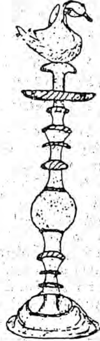
A. el-Hasanî, el-Ye- zidiyyûn fi Hâziri- him ve Mâzihim, Sayda, 1951. Kapak resmi.