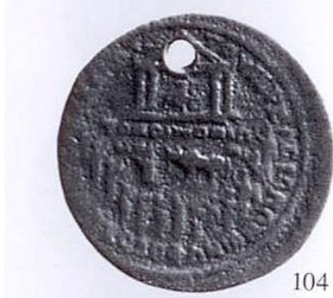
Apollon Klarios önünde toplanmış 13 Ion kenti tanrıçası