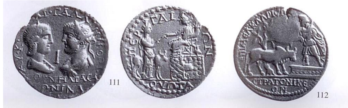
111-Perge Tyhke'si onunde , 112 Tarsos Apollon Lykios'u önünde kurban ediliři