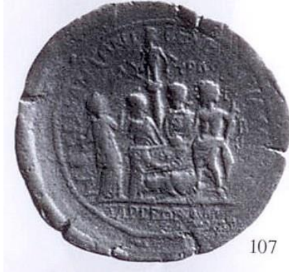
Tarsos Kurbanlık bğ̈a/sunak ve Apollon Lykeios heykeli ve onunde duran 3 kiři