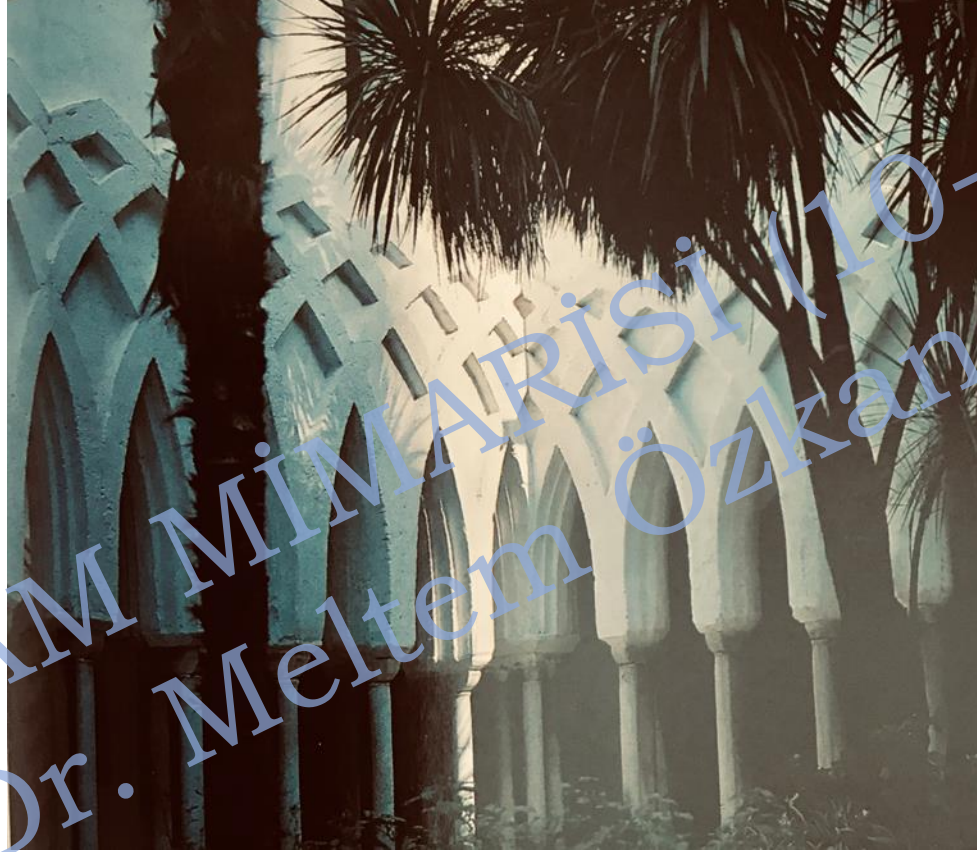
Amalfi Katedrali, Cennet Revakları, 1255-1268