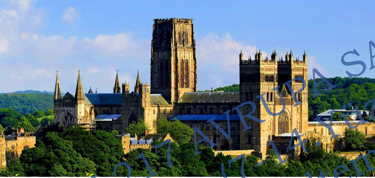
Durham Katedrali, Batı cephe, İngiltere, 1093-1133 (28)

Kaynak: https://www.durhamcathedral.co.uk/