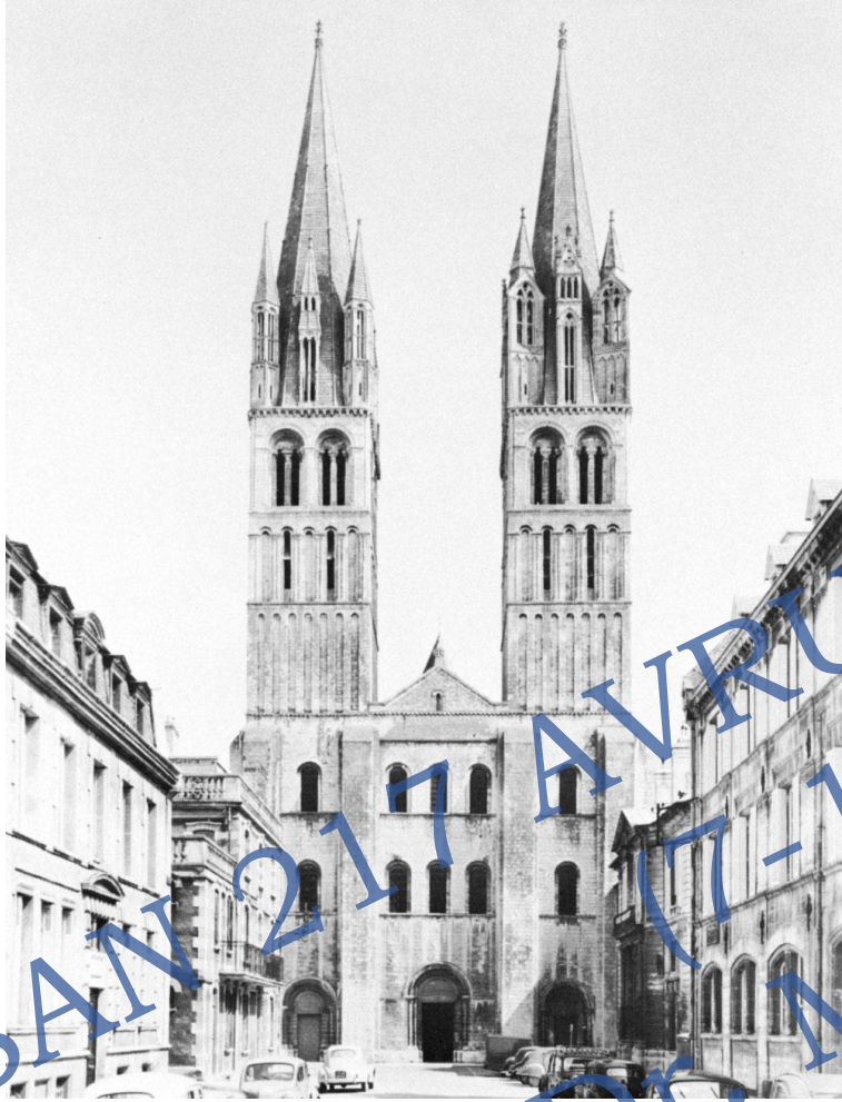
Saint-Etienne Kilisesi, Caen, Normandy, Fransa, 1130