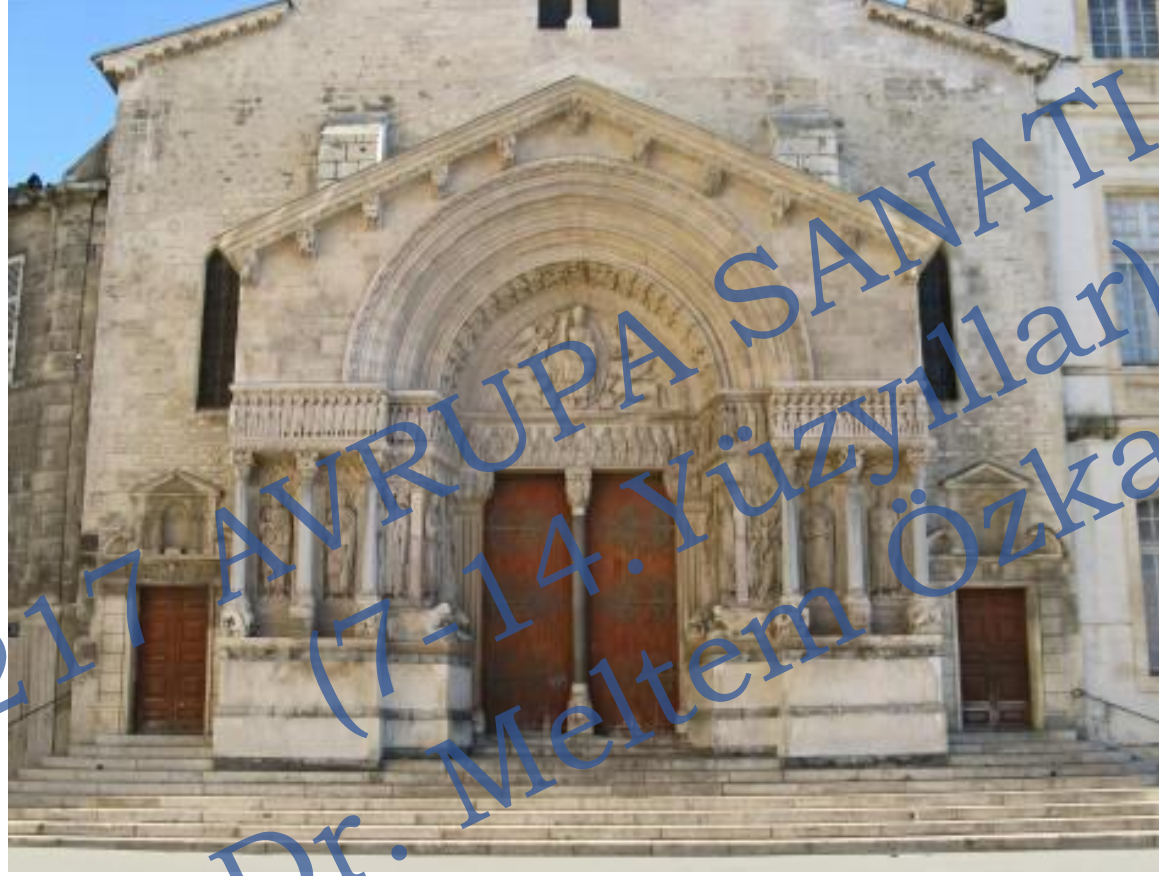
St. Trophime, Tahtında İsa