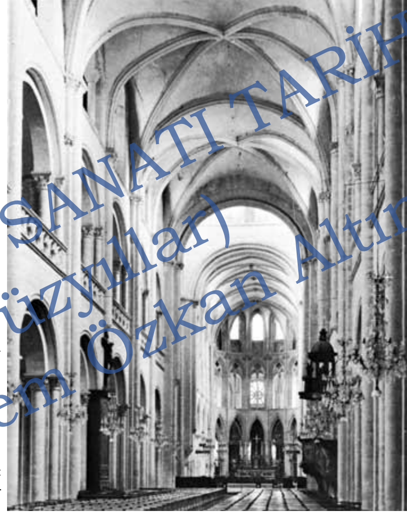
Saint-Etienne Kilisesi Nef, Tonzlar Caen, Normandy, Fransa, 1130