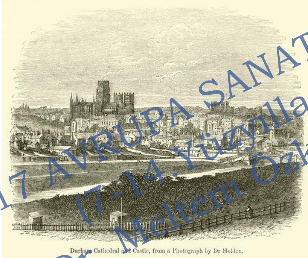
Durham Cathedral and Castle, from a Photograph by Dr Holden.