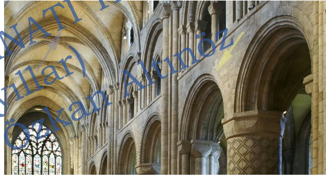
Kaburgalı hac tonoz ilk kullanım