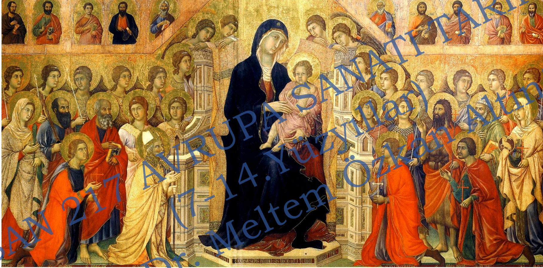
Museo dell'Opera Metropolitana del Duomo, Siena