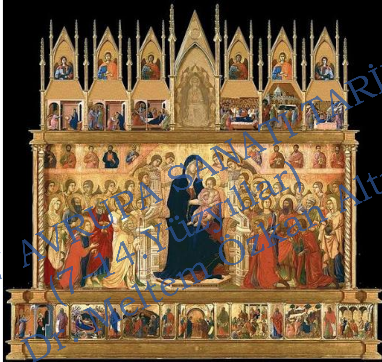
Duccio di Buoninsegna, 1308–1311, Maesta 213 cm x 396 cm