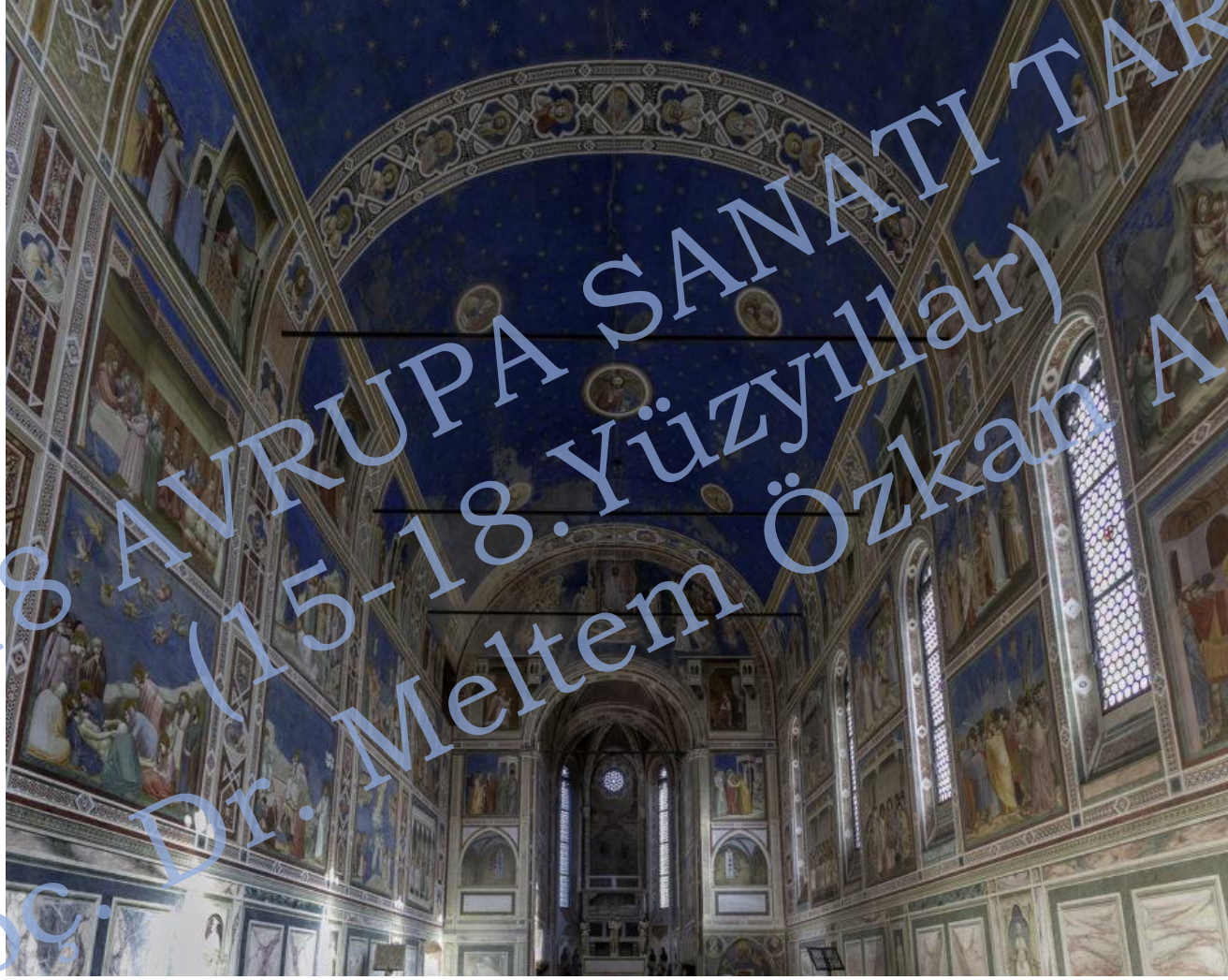
Giotto, Arena (Scrovegni) Şapeli, Padua,. 1305 civarı