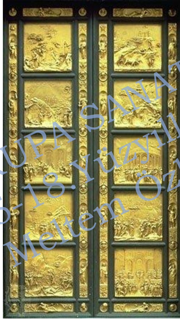
Cennet Kapısı , 1425-52, Yıldızlı bronz Ghiberti, Lorenzo