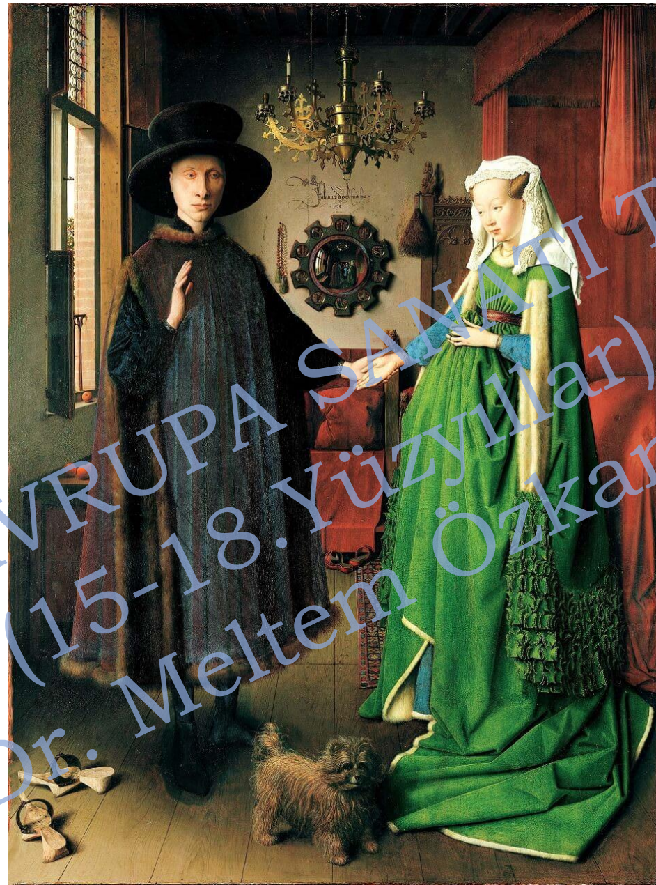
Jan van Eyck, Arnolfini Portresi 1434 Yağlıboya