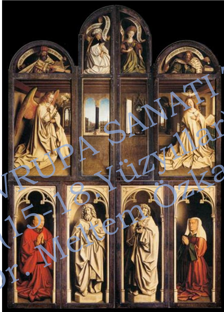
Ghent Altarpiece, 1432, Jan Van Eyck Altarpanosu