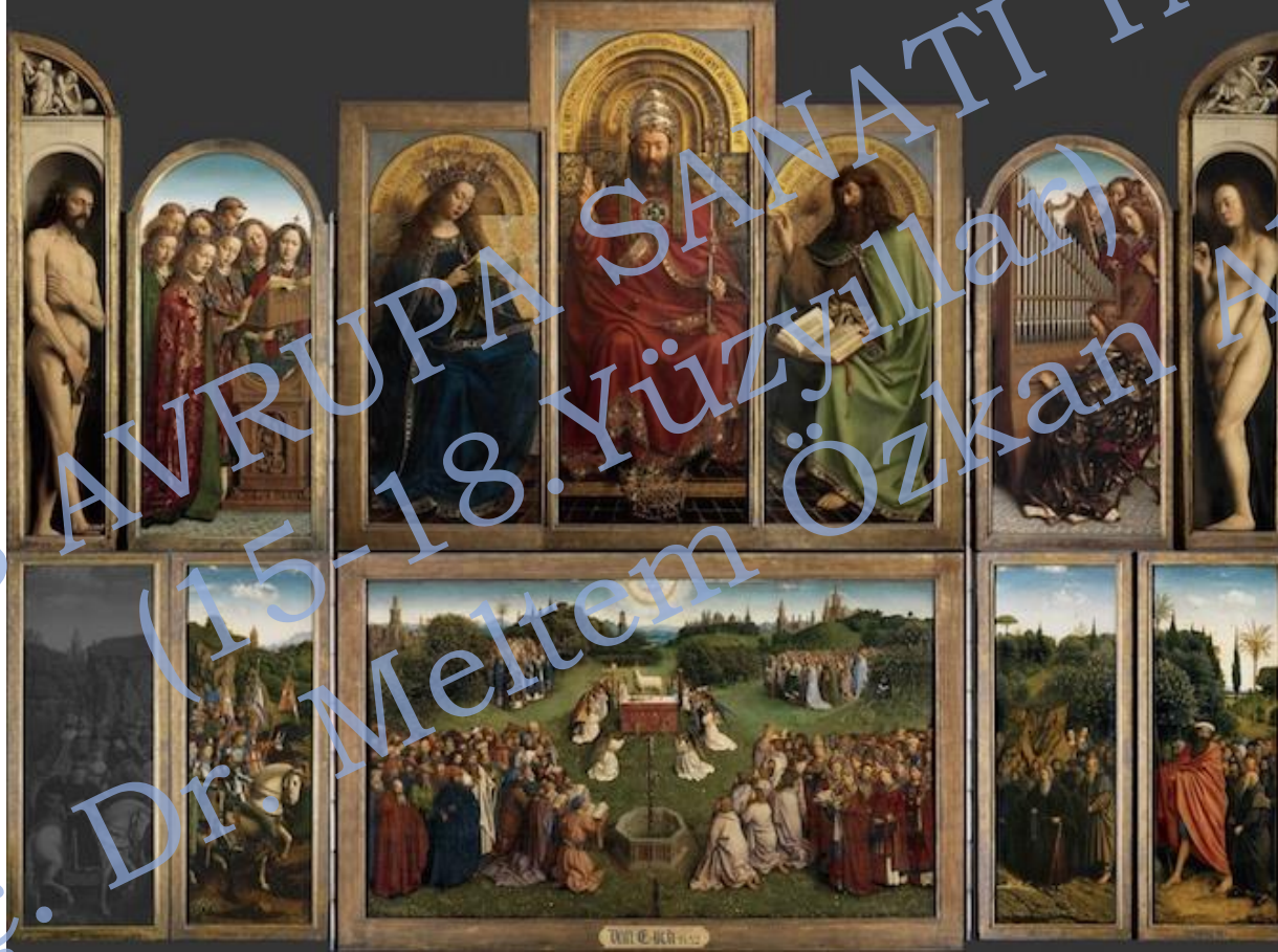
Jan van Eyck, Ghent Altarpiece (açık), 1432, ahşap üzeri yağlıboya Saint Bavo Katedrali, Ghent