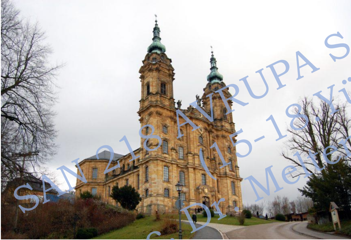
Balthasar Neumann, Vierzehnheiligen (Fourteen Holy Helpers) Church (Germany), 1742–1744 Ondört Kutsal Yardımcı Bazilikası, Bavaria