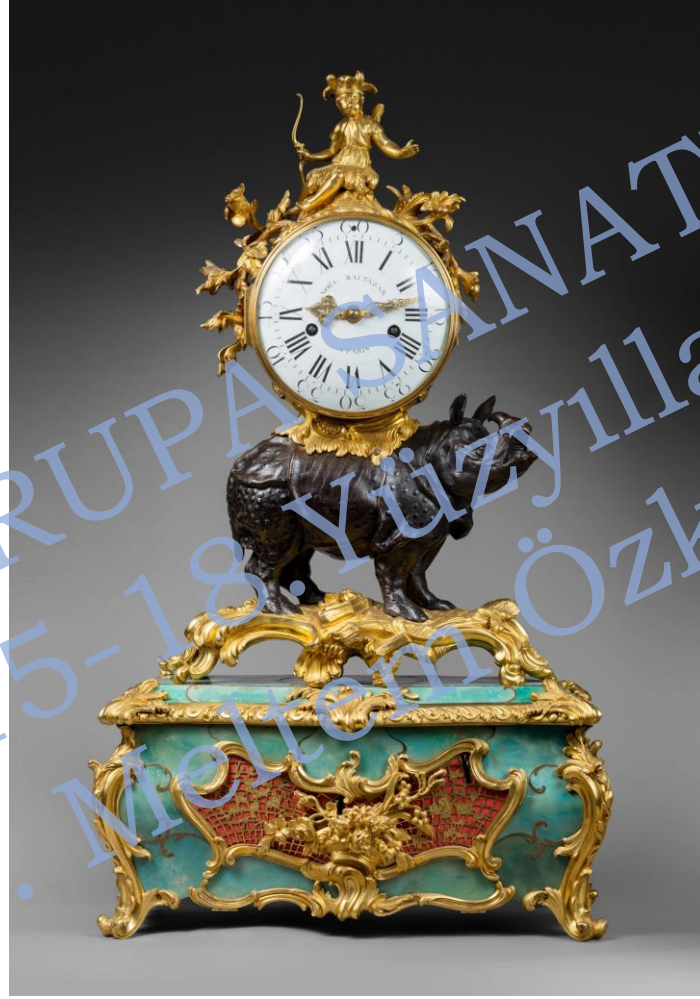
Noël Baltazar,1755 Yaldızlı bronz, 92 x52 cm, derinlik 24 cm.