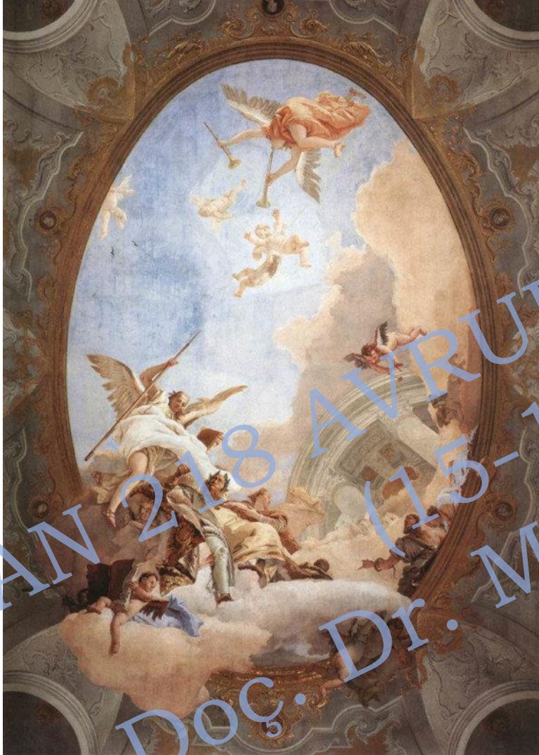
Phillip Friederich von Hetsch's Allegory of Merit Accompanied by Nobility and Virtue (1758).