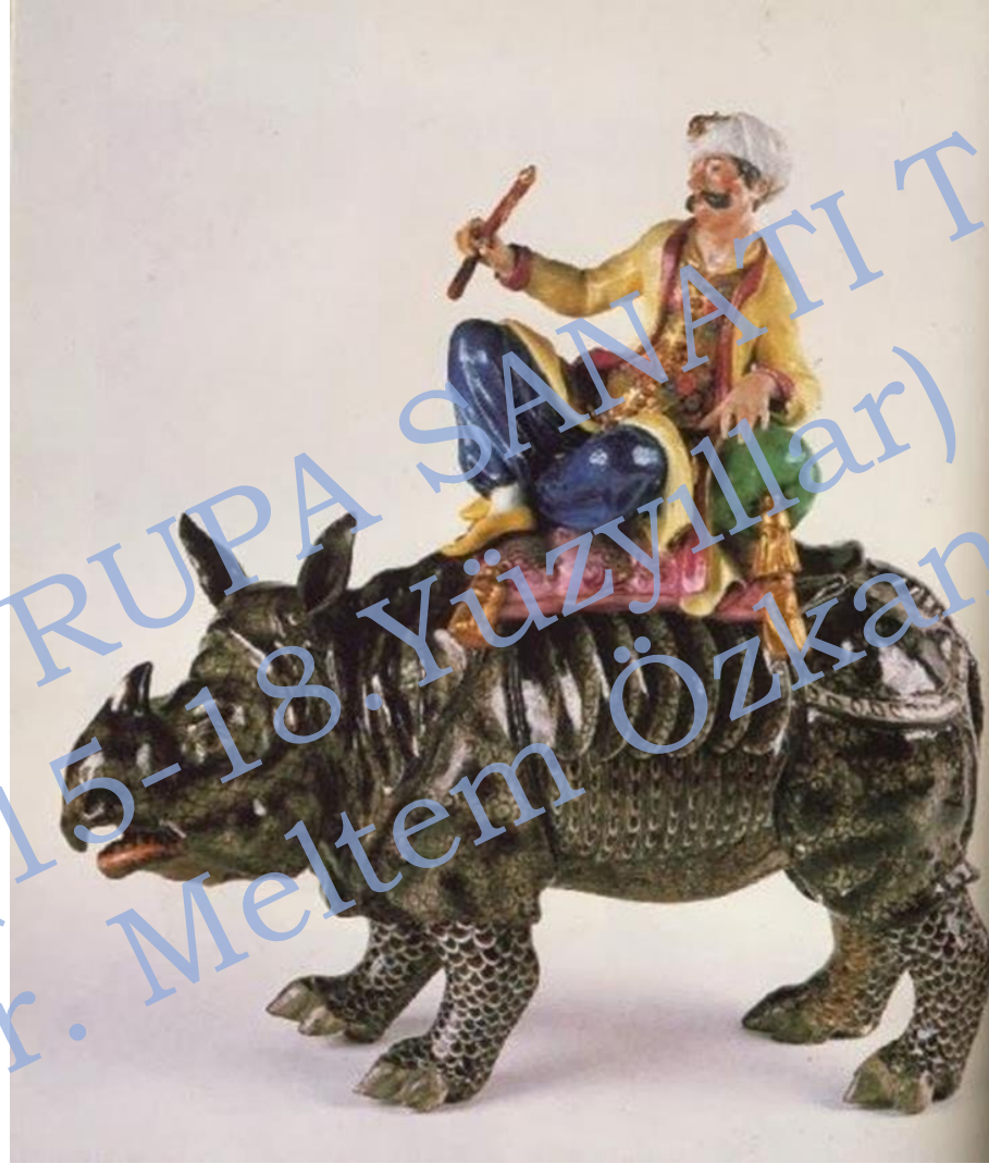
"Turk Riding a Rhinoceros", 1752, Johann Joachim Kändler, Meissen Porcelain Manufactory