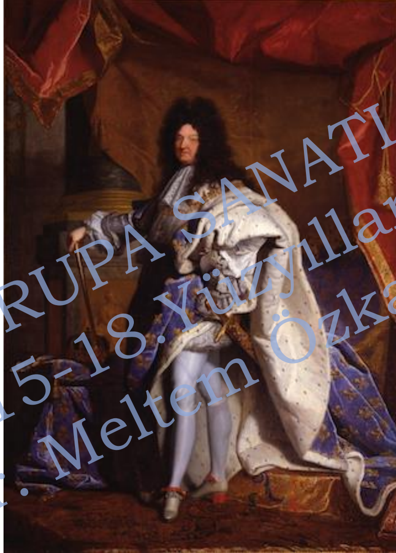
Hyacinthe Rigaud, Louis XIV, 1701, Kanvas üzeri yağlıboya, 114 x 62 (The J. Paul Getty Museum)