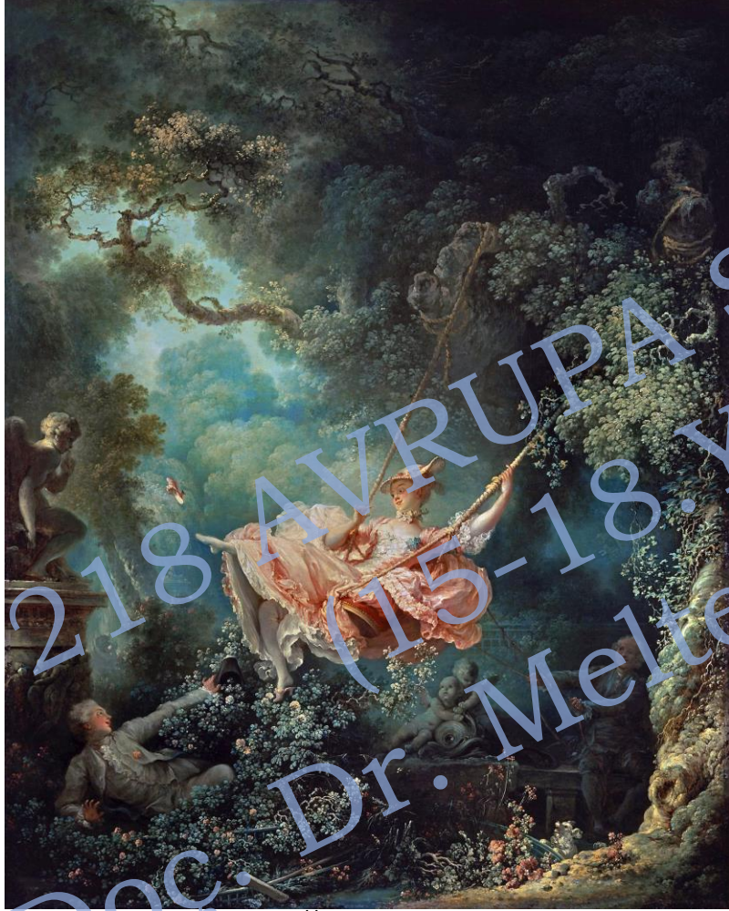
Jean-Honoré Fragonard, 'The Swing' (1767-1768), Salıncak (Wallace Collection, London)