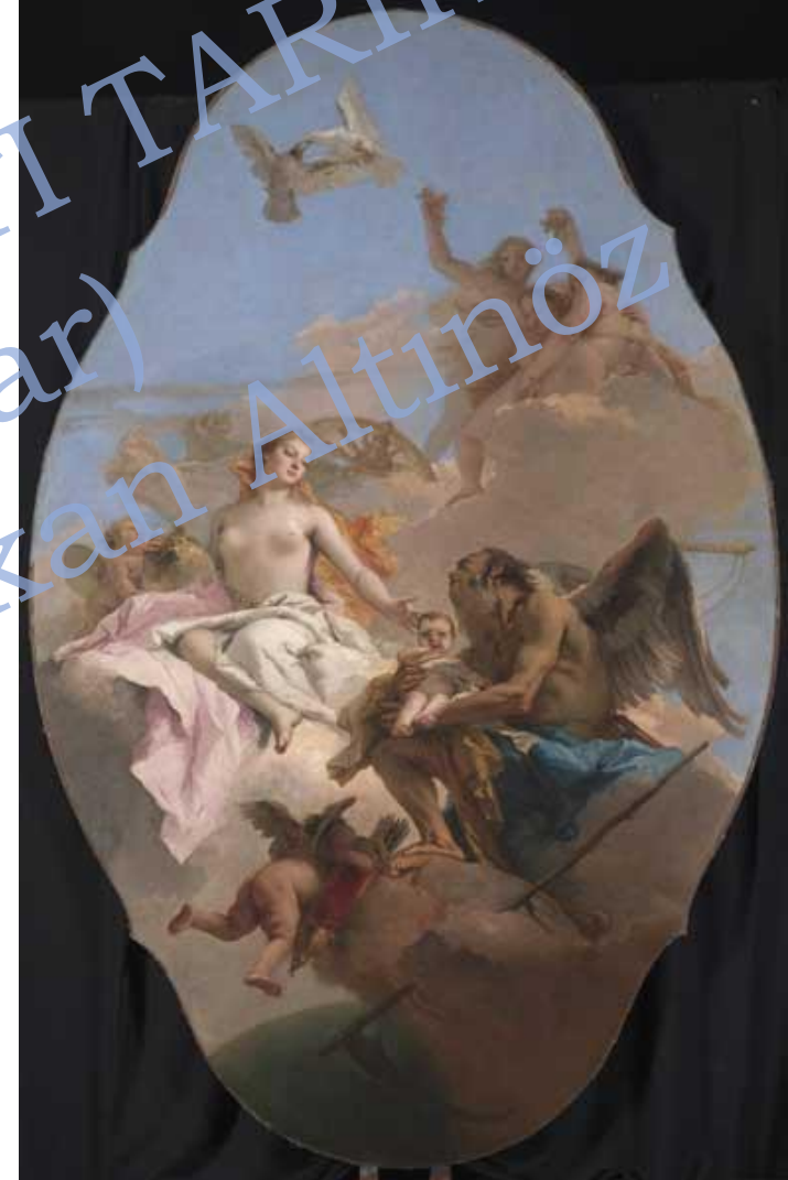
Giambattista Tiepolo, An Allegory with Venus and Time , 1753-8