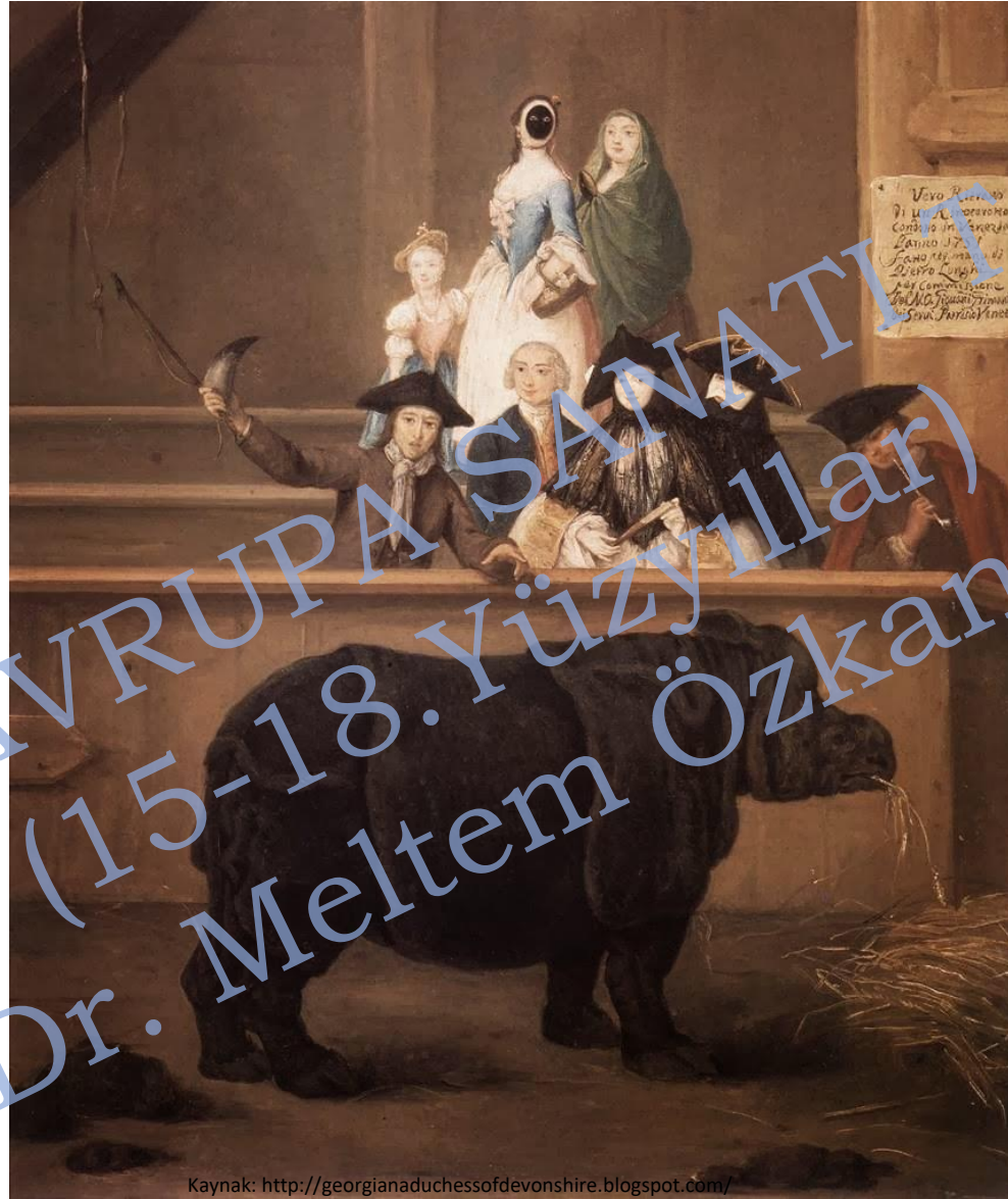
Venedik'te Gergedan Sergisi, Pietro Longhi, 1751, Kanvas üzeri yağlıboya, (47 x 60,4 cm.) National Gallery, Londra.