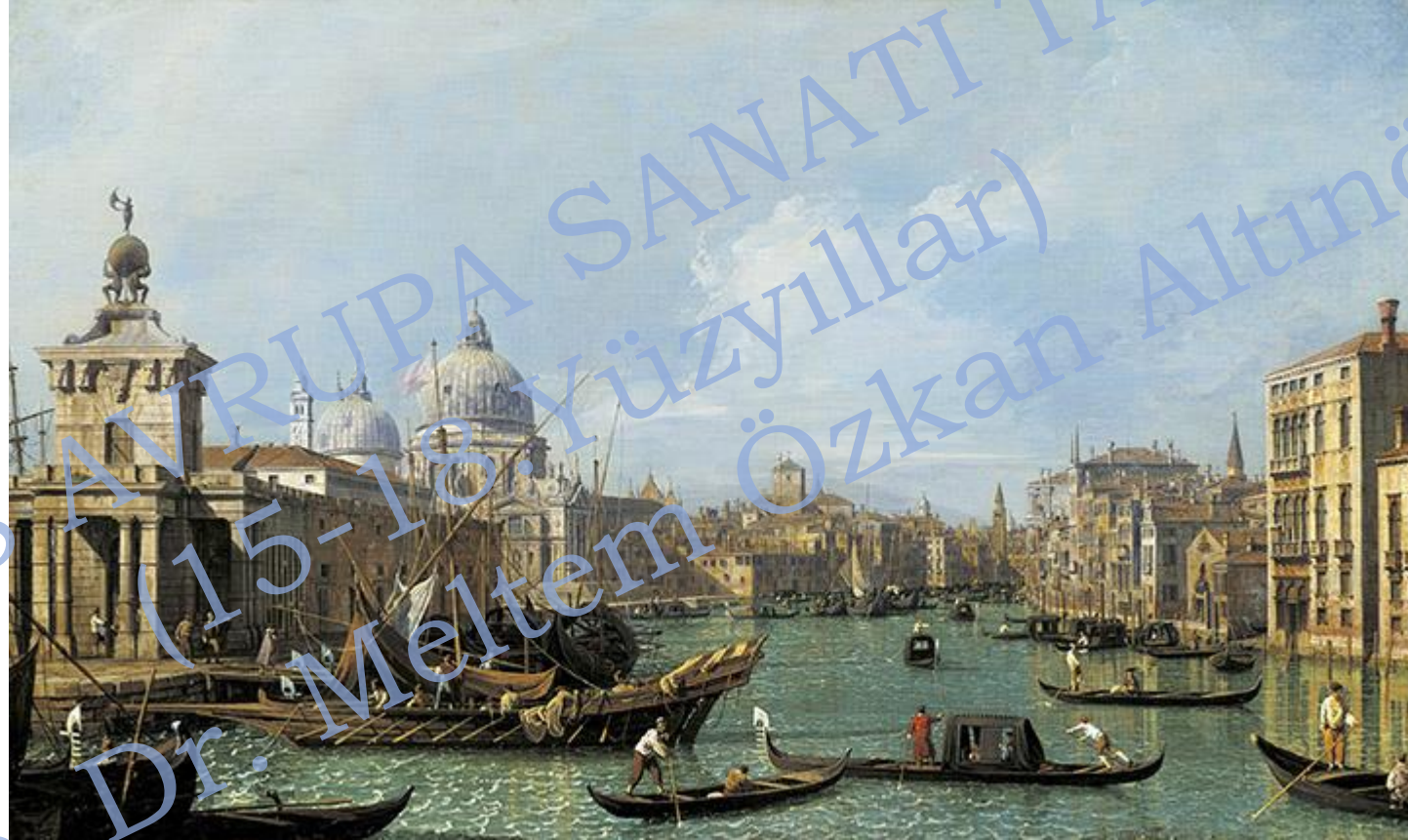
Canaletto, The Mouth of the Grand Canal looking West towards the Carita, 1729-30 civarı