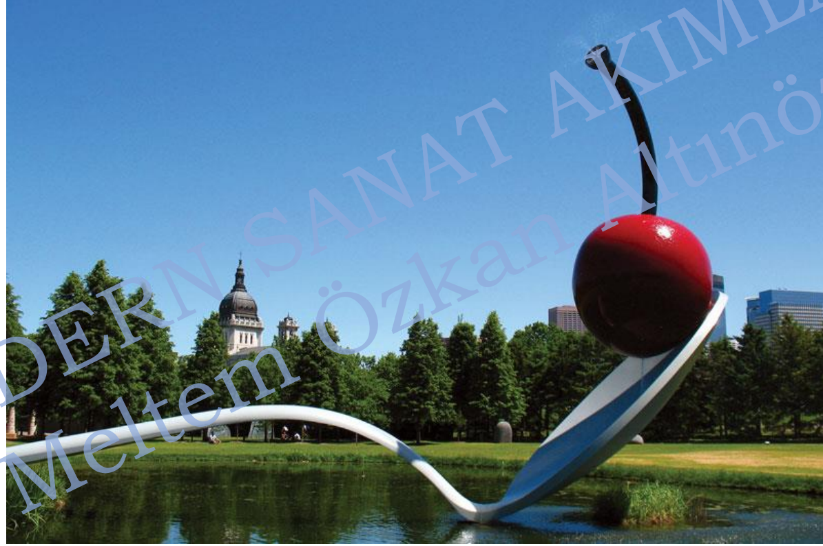
Claes Oldenburg, Spoonbridge and Cherry, 1988