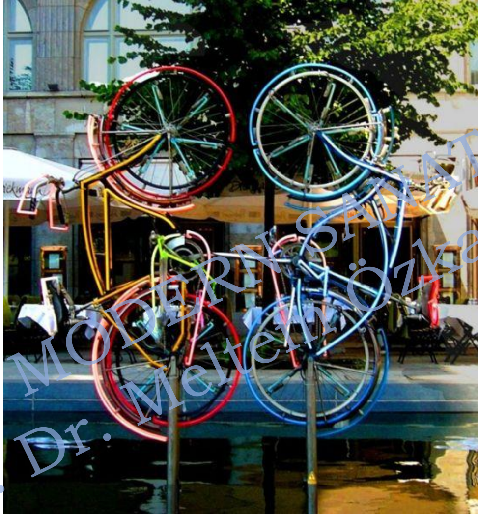
Riding Bikes, Berlin, 1998, Rouschenberg