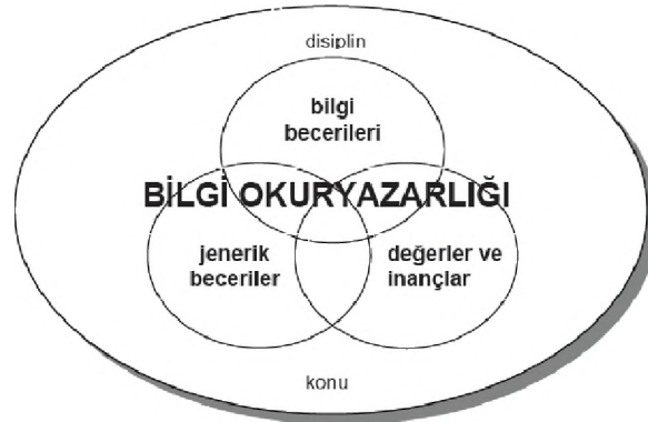
(Şekil 2): ANZIIL, Bilgi Okuryazarlığının Unsurları Modeli (Bundy, 2004, s.7).

ANZIIL'in Bilgi Okuryazarlığının Unsurları Modeli ise diğer modellerden oldukça farklıdır. Bu model, jenerik beceriler; bilgi becerileri; değerler ve inançlar olmak üzere birbirleriyle ilişkili üç temel unsurdan oluşmaktadır. Bunlara ek olarak, konu ve disiplin de belirleyici unsur olarak modele eklenmiştir. Jenerik beceriler problem çözme, eleştirel düşünme, iletişim ve işbirliği gibi becerileri; bilgi becerileri bilgi arama ve kullanma gibi bilgi problemi çözme aşamalarını ve bilgi teknolojileri kullanma becerilerini; değerler ve inançlar ise bilginin etik kullanımı ve sosyal sorumluluklar gibi unsurları içermektedir (Bundy, 2004, s.7) (Şekil 2).