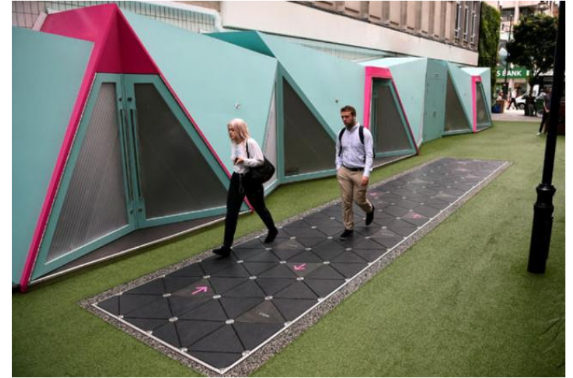
Piezoelektrik seramik ile İngilterede akıllı sokaklar