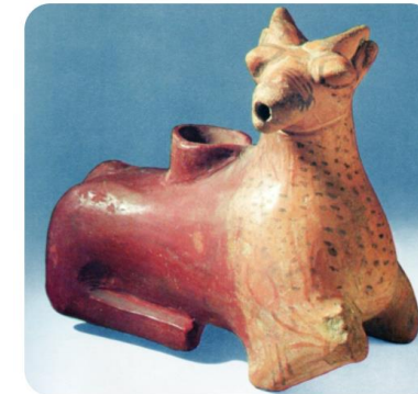
Kültepe-kaniş'ten seramik ryton, Hitit Dönemi, MÖ 1900