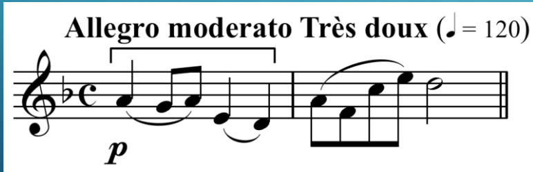
Ravel, Yaylı Kuartet , 1.bl