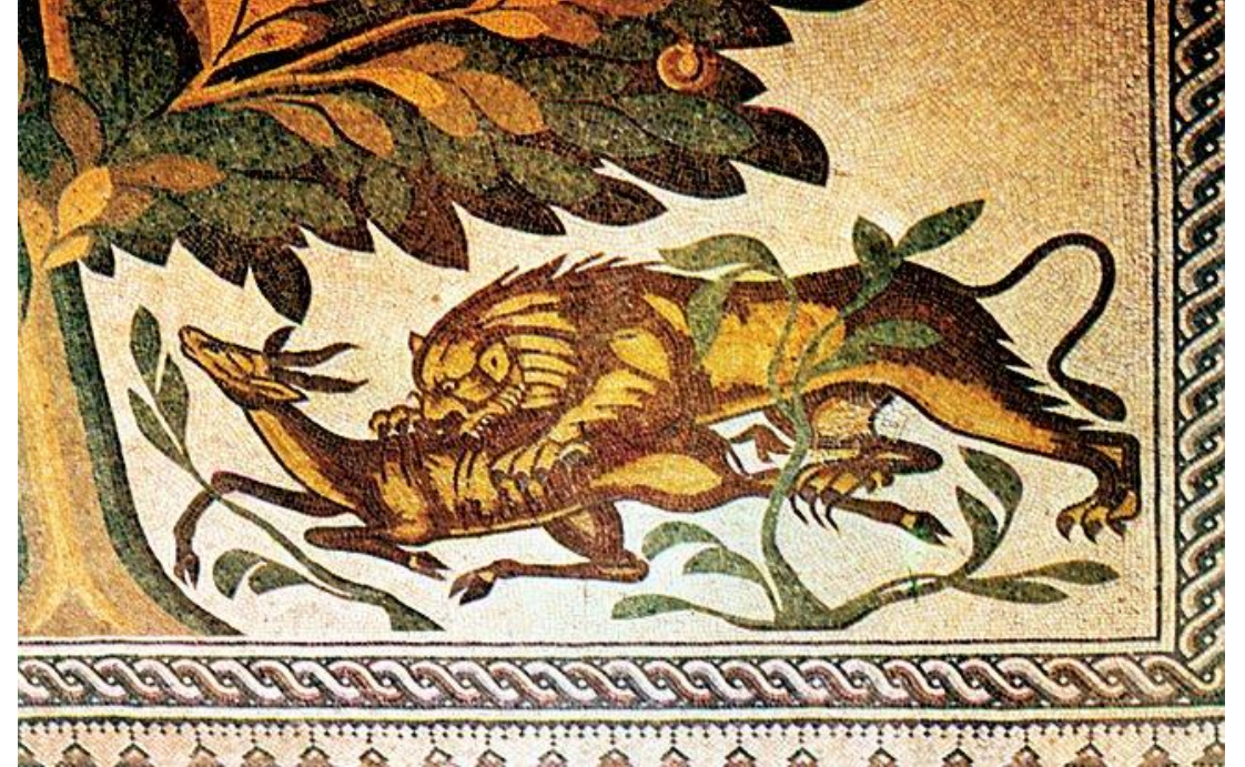
Görsel: Hırbetü'l-mefcer adlı Emevî sarayının mozaik süslemelerine bir örnek – Filistin

Muaviye'nin kendiden sonra oğlu Yezid'i veliht olarak tayin etmesi, halifeliğin devrinde veraset sisteminin ortaya çıkması ile halifelik kurumu yeni bir boyut kazanmıştır.