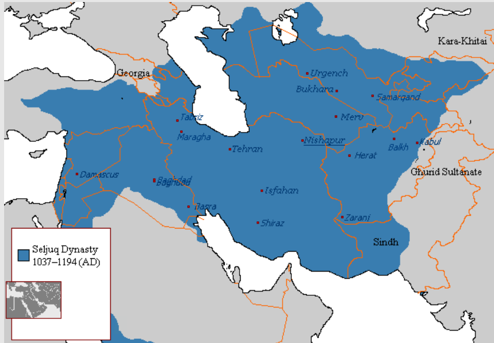
Büyük Selçuklu Devleti,

İslam Halifeleri, Büyük Selçuklu Devletinde etkilerini, güç dengeleri ile göstermeye çalıştılar. Ulema; devlet teşkilatı ile yakın ilişkisi nedeniyle dini zümreyi, Sultan ve Halife arasında iletişim kanalı haline getirme ve devlet içindeki hassas dengeleri koruyabilmeyi sağlamada bağımsız bir kesim olarak kalmayı başaramadılar. Bürokratlar, İran devlet geleneği ve İslam kültürü konusunda eğitildikleri için, eski devlet gelenekleri ile İslam kültürünü birleştirmede daha mahirlerdi.